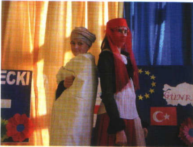
Spotkanie z kulturą Turcji