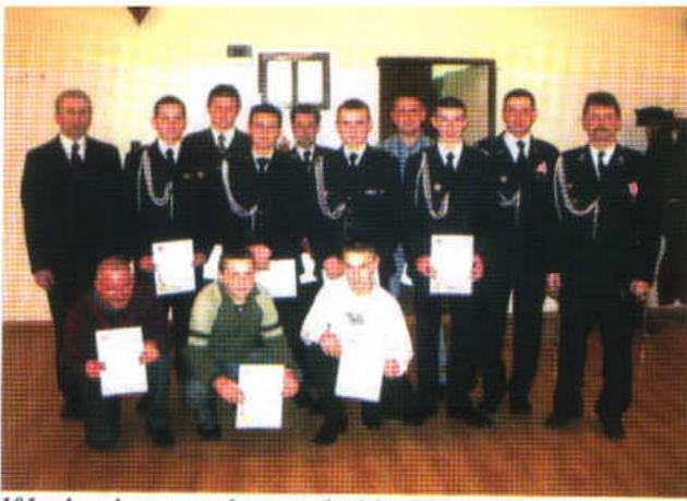
101 zebranie sprawozdawcze członków OSP