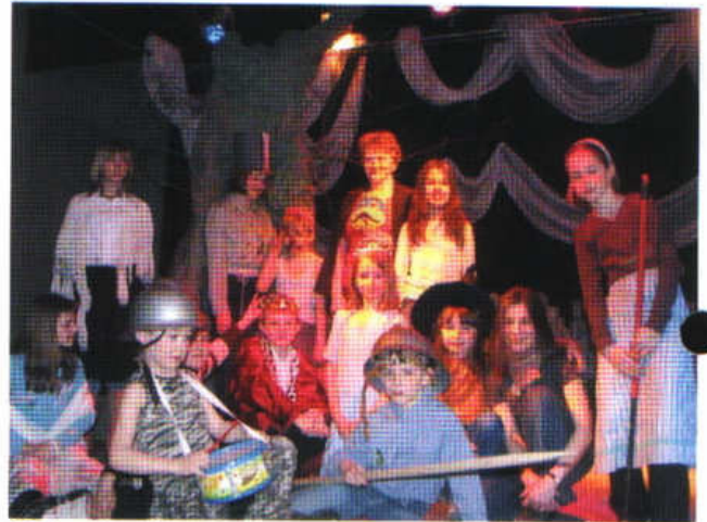
Spektakl pn. Krzesiwo