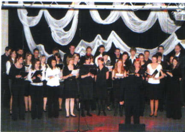
Koncert Instytutu Muzyki Akademii im. Jana Długosza w Częstochowie - 27 kwiecień