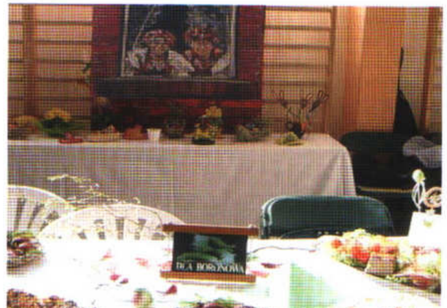
III prezentacja stołów wielkanocnych - Kochcice.