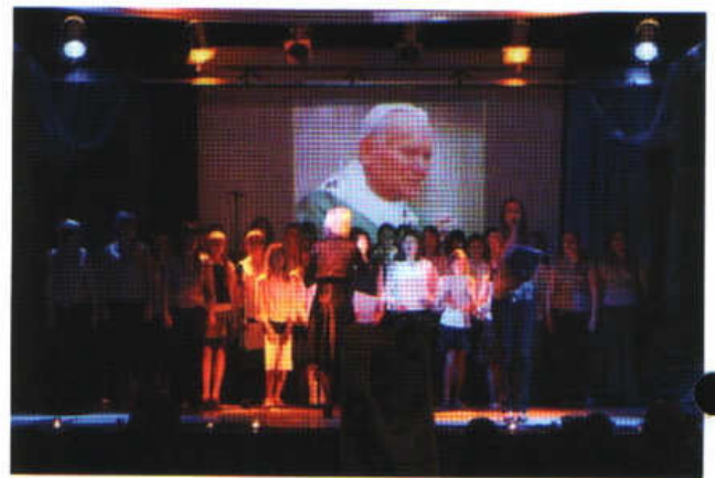
Koncert Pamięci - 6 kwietnia