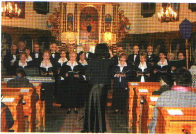
Koncert Chóru LUTNIA z Koszęcina