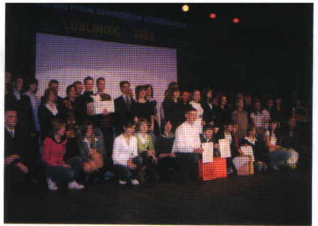
III Powiatowe Forum Samorządów Uczniowskich