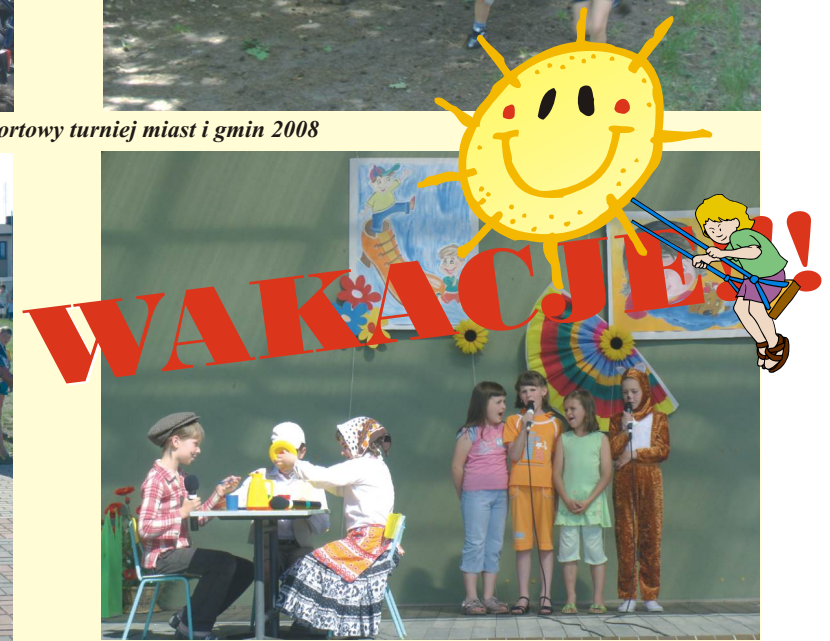
Festyn rodzinny - 1 czerwiec -występ dzieci z Komorni Lhotka