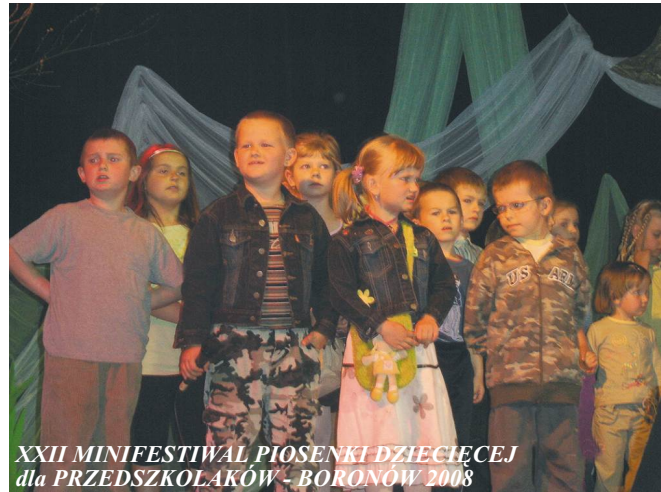
XXII MINIFESTIWAL PIOSENKI DZIECIĘCEJ dla PRZEDSZKOLAKÓW - BORONÓW 2008