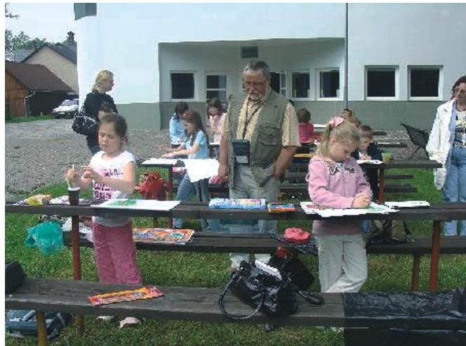
Konkurs w Komorni Lhotka