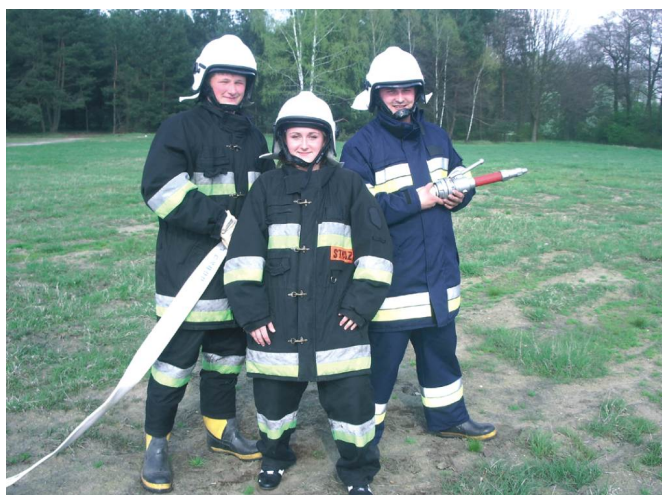
Kurs I stopnia dla członków OSP w Boronowie