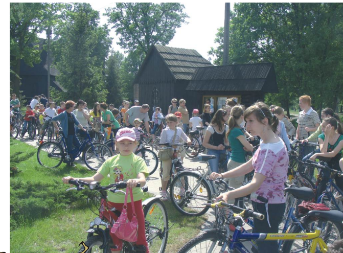
XIV ogólnopolski sportowy turniej miast i gmin 2008