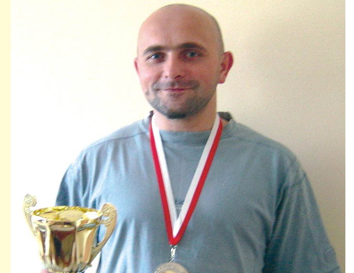
IX Mistrzostwa Polski Radnych i Pracowników Samorządowych w tenisie stołowym