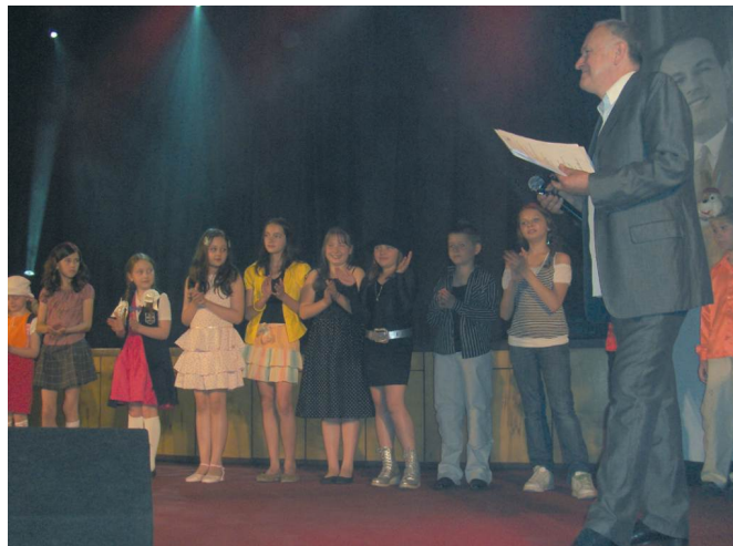
V Europejski Integracyjny Festiwal Piosenki Dziecięcej w Sosnowcu