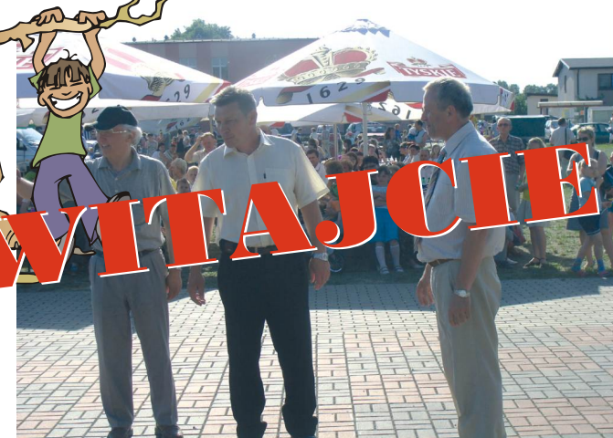
Festyn rodzinny - 1 czerwca