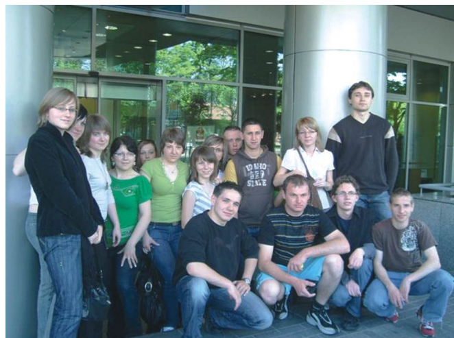
Uczestnicy Aktywnej Wiosny - Warszawa 2008