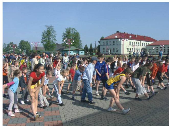
XIV ogólnopolski sportowy turniej miast i gmin 2008