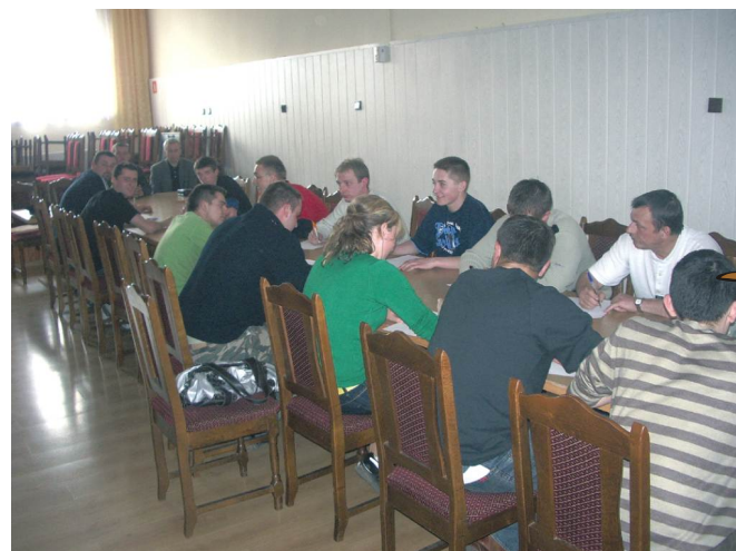
Kurs I stopnia dla członków OSP w Boronowie