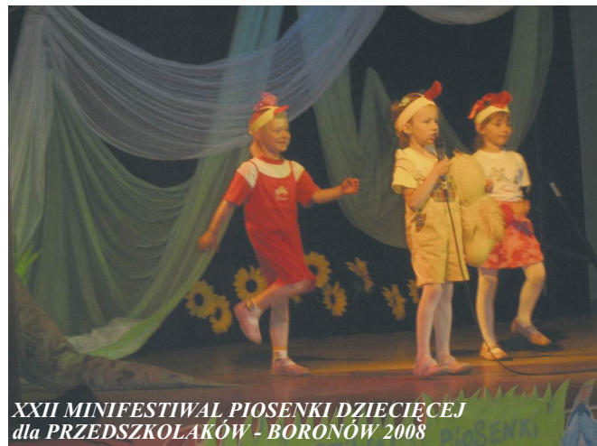
XXII MINIFESTIWAL PIOSENKI DZIECIĘCEJ dla PRZEDSZKOLAKÓW - BORONÓW 2008