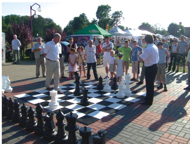
Gra szachami plenerowymi.