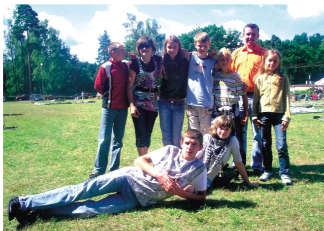
Międzynarodowy Obóz Młodzieżowych Drużyn Pożarniczych - Koszecin 2008