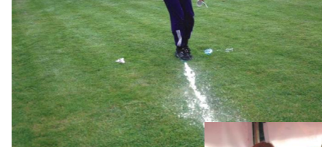
Goczałkowice 15 sierpnia