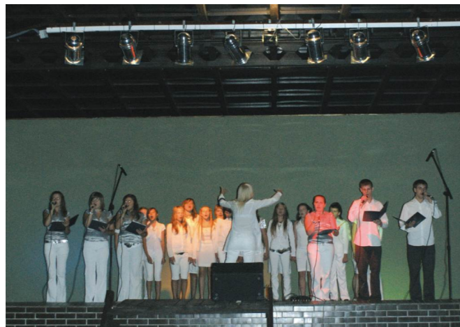
Koncert zespołu AGAT na cześć XVI Diecezjalnej Pielgrzymki Gliwickiej na Jasną Górę