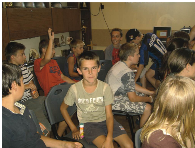
Dzieci podczas szkolenia w ICEO