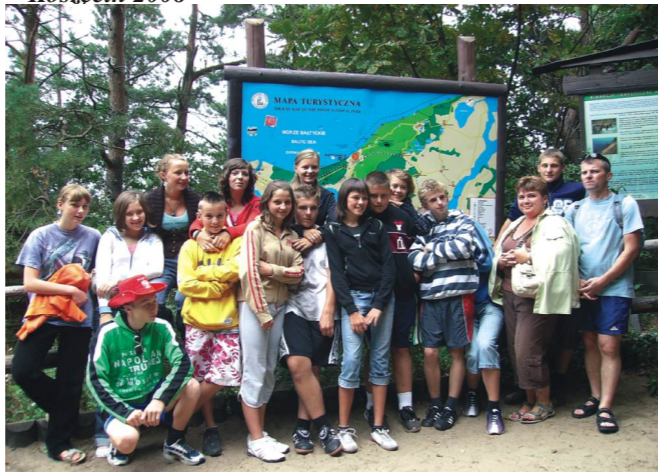
Obóz sportowo - rekreacyjny w Międzyzdrojach