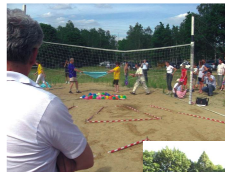
Olsztyn 6 lipca