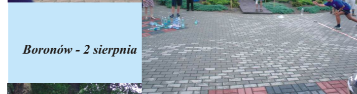
Boronów - 2 sierpnia