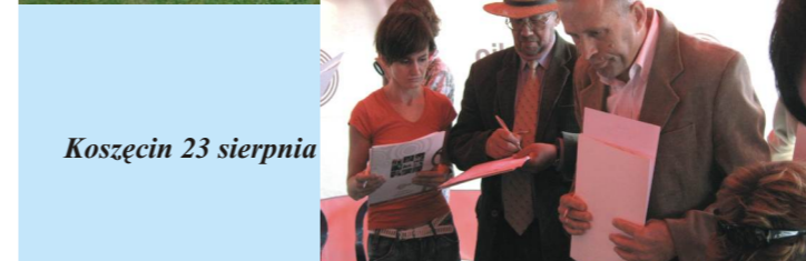
Koszęcin 23 sierpnia