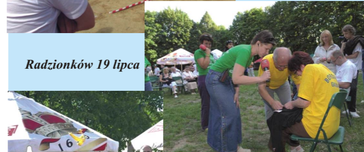
Radzionków 19 lipca