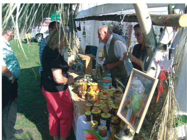
Święto Miodu - Stoisko miodowe