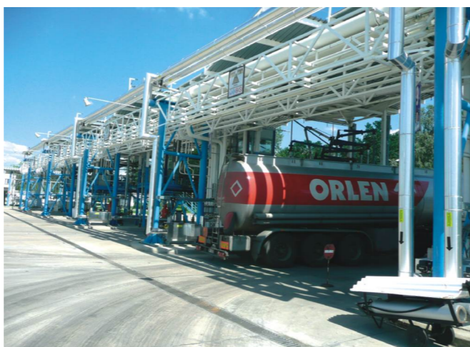
Front Wydawczy Autocysternowy