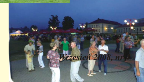
Wrzesień 2008, nr 4