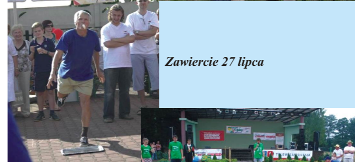
Zawiercie 27 lipca