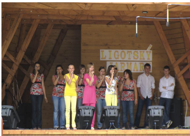
Wizyta w Czechach - Komorni Lhotka