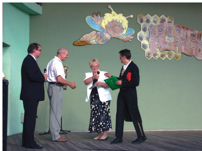
Święto Miodu - Przekazanie pucharu.