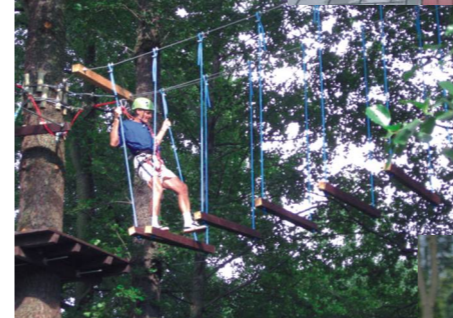
Janów 3 sierpnia