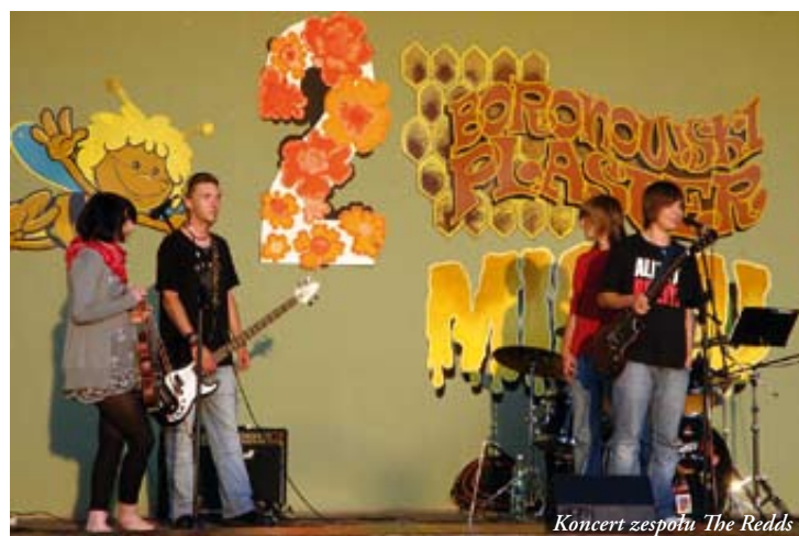
Koncert zespołu The Redds