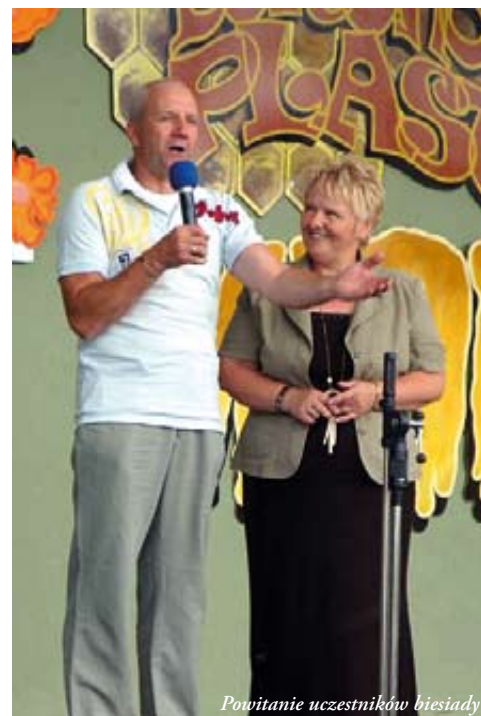
Powitanie uczestników biesiady