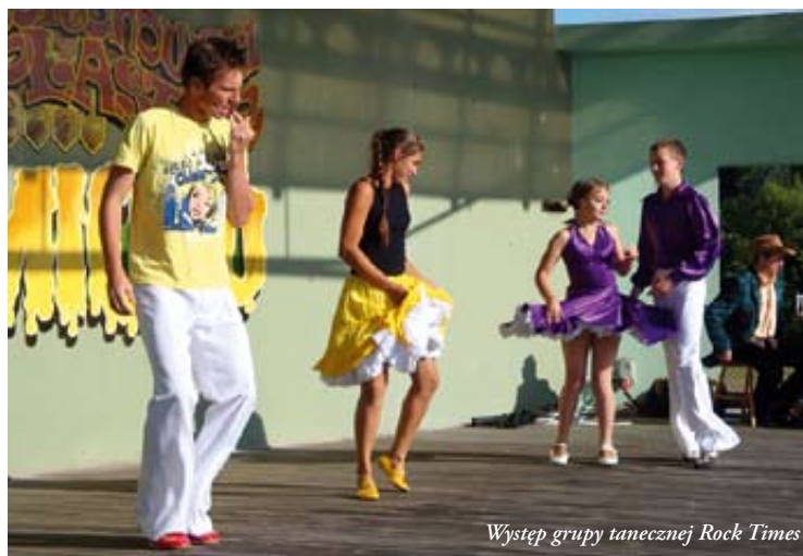
Występ grupy tanecznej Rock Times