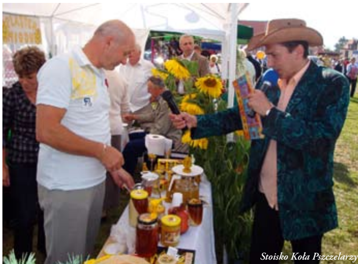
Stoisko Koła Pszczelarzy