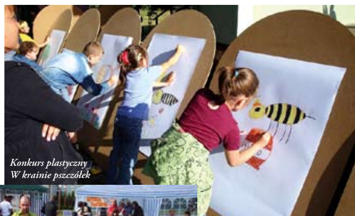
Konkurs plastyczny W krainie pszczołek