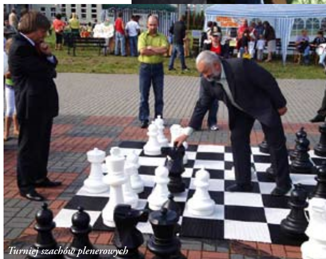
Turniej szachów plenerowych