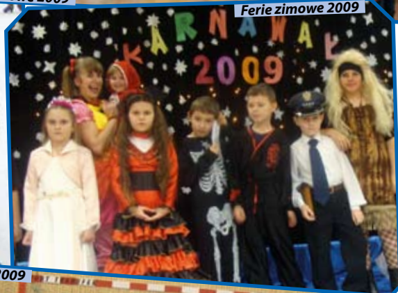
Ferie zimowe 2009