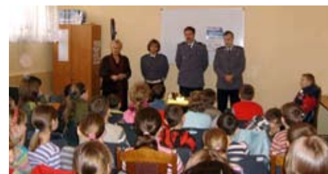
Spotkanie dzieci z policjantami