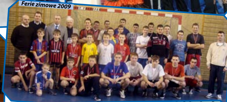
Ferie zimowe 2009