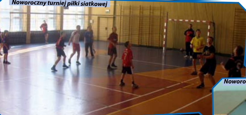
Noworoczny turniej piłki siatkowej