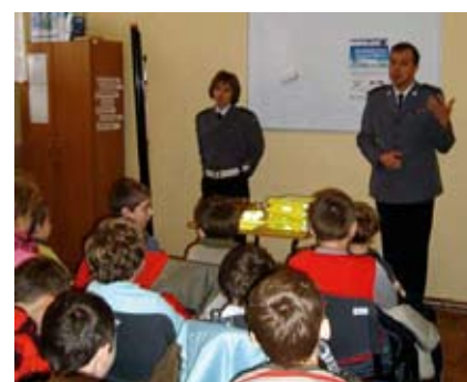
Prelekcja policjantów z sekcji ruchu drogowego