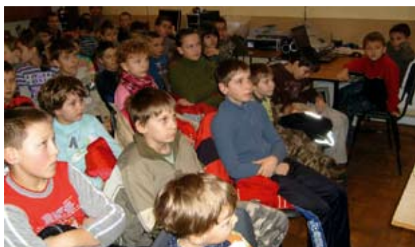
W czasie prelekcji z zakresu bezpieczeństwa w ruchu drogowym