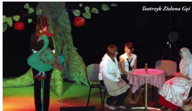
Teatrzyk Zielona Gęś