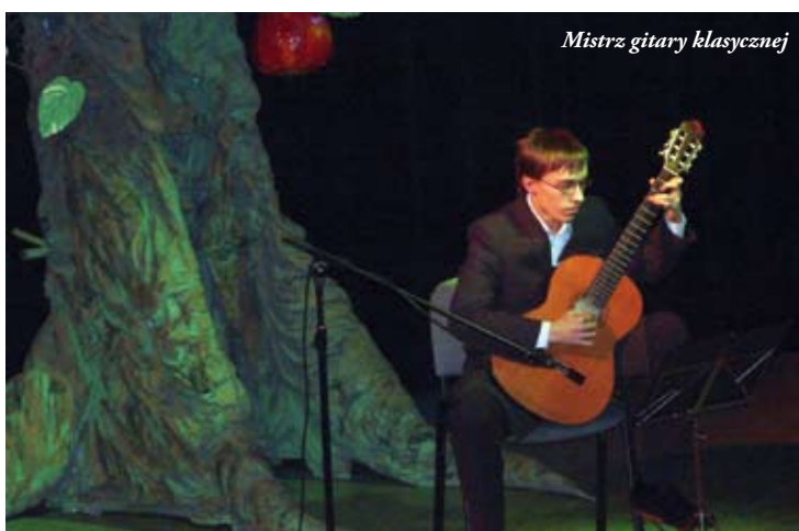
Mistrz gitary klasycznej