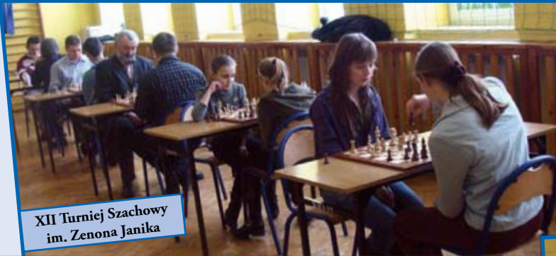
XII Turniej Szachowy im. Zenona Janika