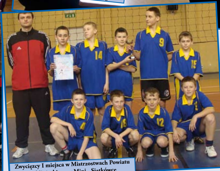
Zwycięzcy I miejsca w Mistrzostwach Powiatu Lublinieckiego w Mini - Siatkówce