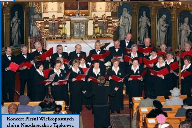
Koncert Pieśni Wielkopostnych chóru Niezdareczka z Tapkowic