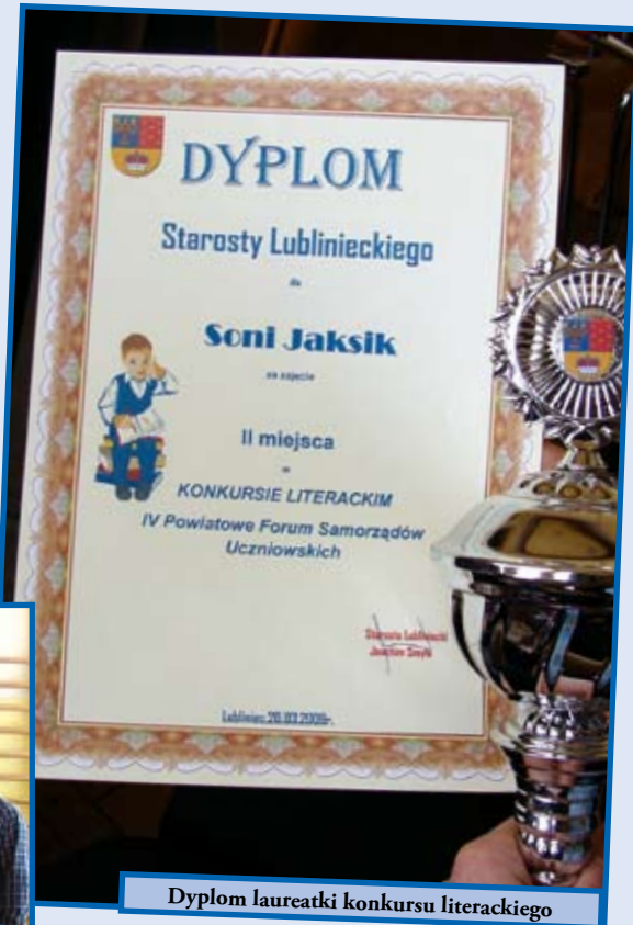
Dyplom laureatki konkursu literackiego