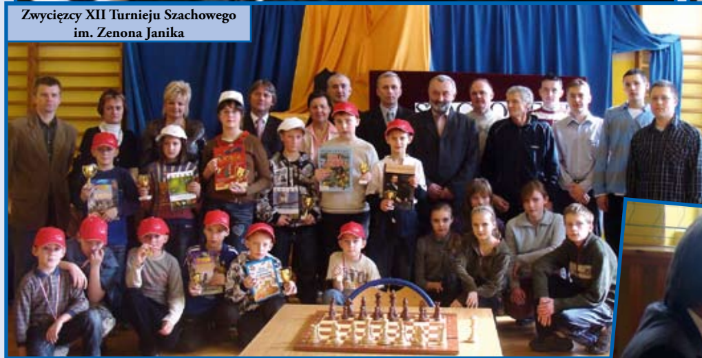
Zwycięzcy XII Turnieju Szachowego im. Zenona Janika