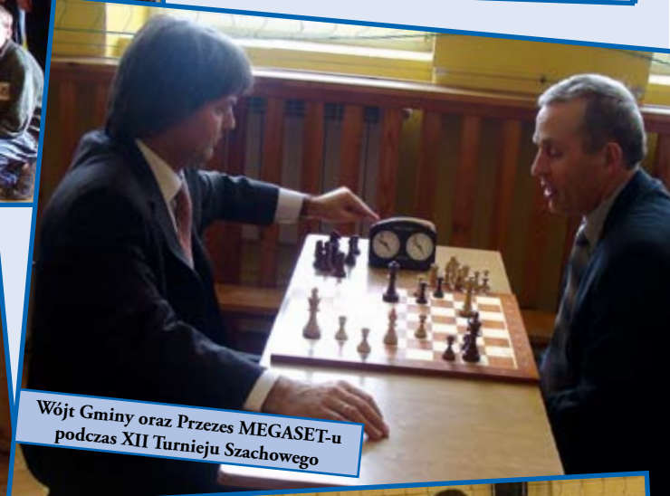
Wójt Gminy oraz Przewodniczący MEGASET-u podczas XII Turnieju Szachowego