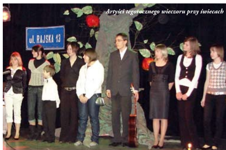
Artyści tegorocznego wieczoru przy świecach

Życzenia Radosnych Świąt Wielkanocnych wypełnionych nadzieją, budzącej się do życia wiosny i wiarą w sens życia, pogody w sercu i radości płynącej z faktu Zmartwychwstania Pańskiego