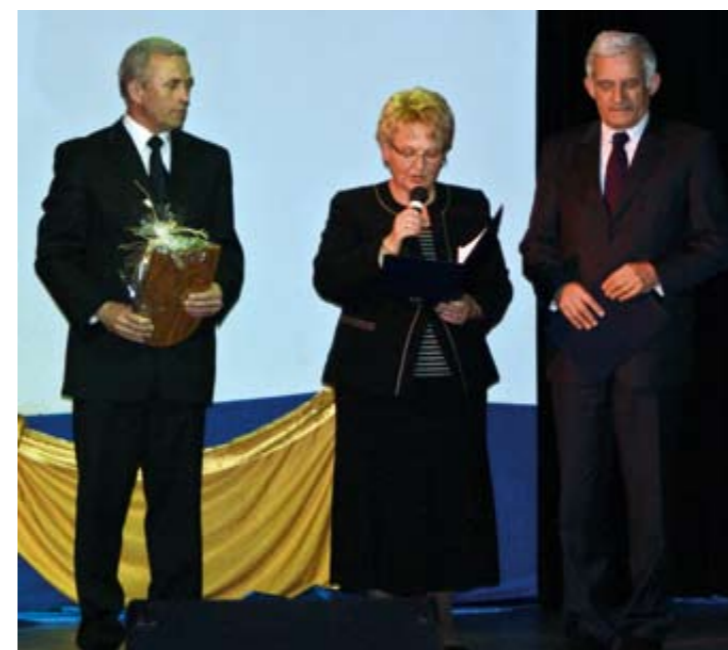
Powitanie Szanownego Gościa