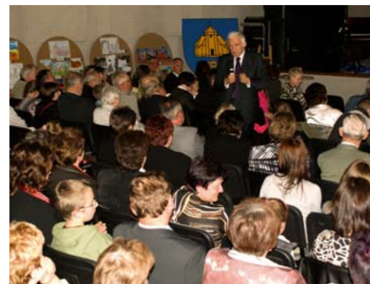
Liczenie zgromadzona widownia