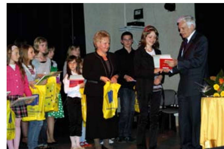
Wręczenie nagród laureatom konkursu powiatowego

Profesor jest znany i ceniony zarówno w kraju, jak i za granicą za podejmowanie wielu cennych inicjatyw, na przykład w zakresie energetyki odnawialnej. Sprawił też, że zagraniczne rozmowy komórkowe są kilkakrotnie tańsze. Profesor Buzek jest inicjatorem wielu seminariów i warsztatów europejskich, w których uczestniczą również uczniowie szkoły z Boronowa.