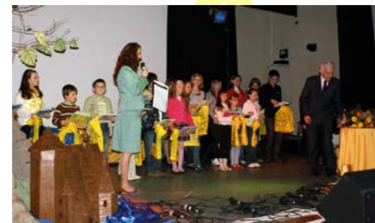
Laureaci plastycznego konkursu