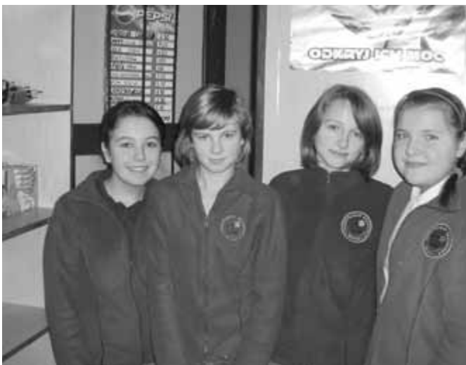
Uczniowie szkoły podstawowej ZPO w Boronowie w sklepiku szkolnym