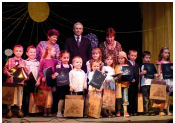
Laureaci Koncertu Galowego XXIV Regionalnego Minifestiwalu Piosenki Dziecięcej dla Przedszkolaków – Boronów 2010.