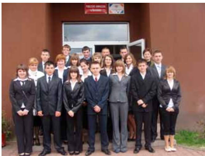
Ważny dzień dla gimnazjalistów – egzaminy!