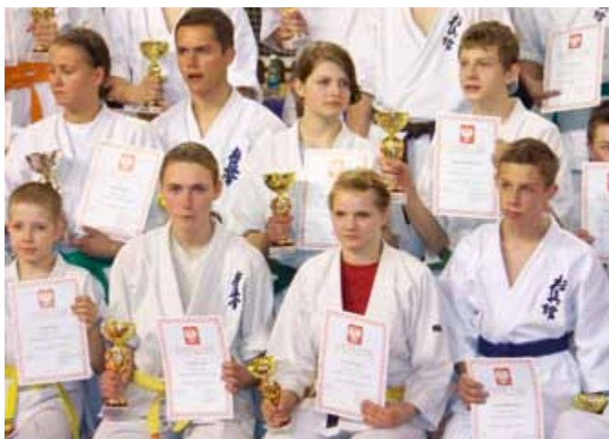
Mistrzostwa Polski Makroregionu Południowego w Karate Kyokushin-kan.