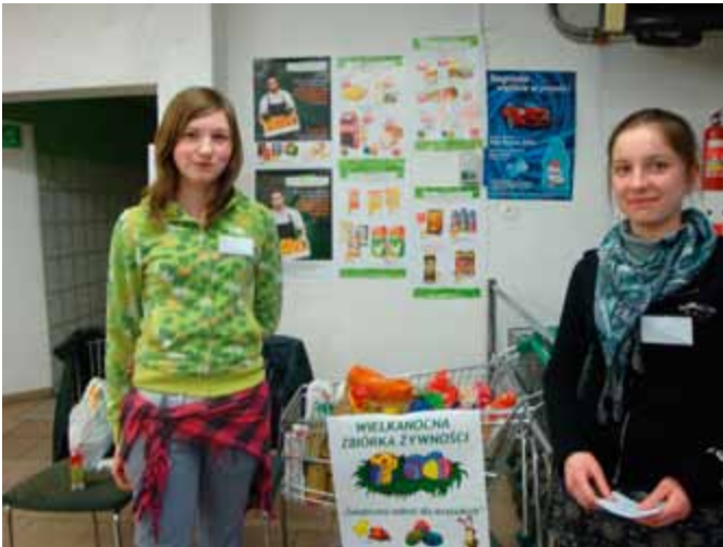
Wielkanocna zbiórka żywności. Wolontraiuski „Stowarzyszenia dla Boronowa”.