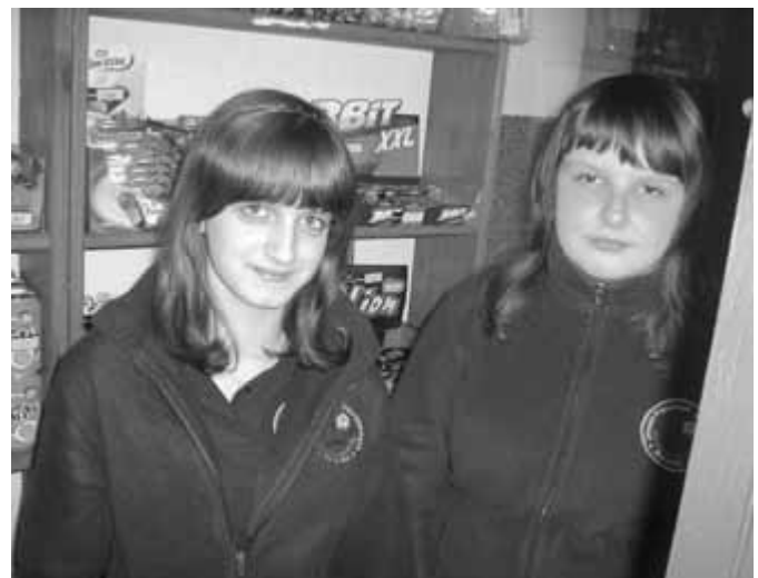
Uczennice gimnazjum w sklepiku szkolnym