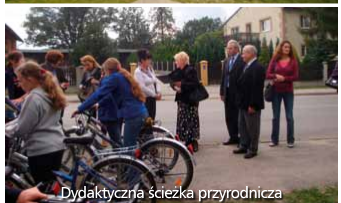
Dydaktyczna ścieżka przyrodnicza