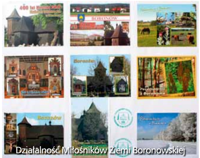
Działalność Miłośników Ziemi Boronowskiej