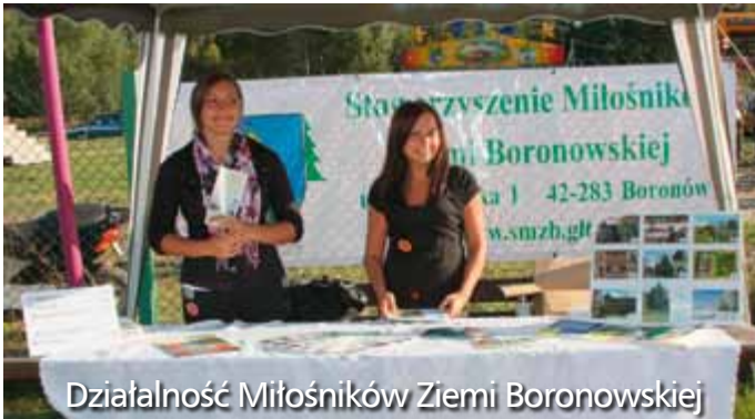
Działalność Miłośników Ziemi Boronowskiej