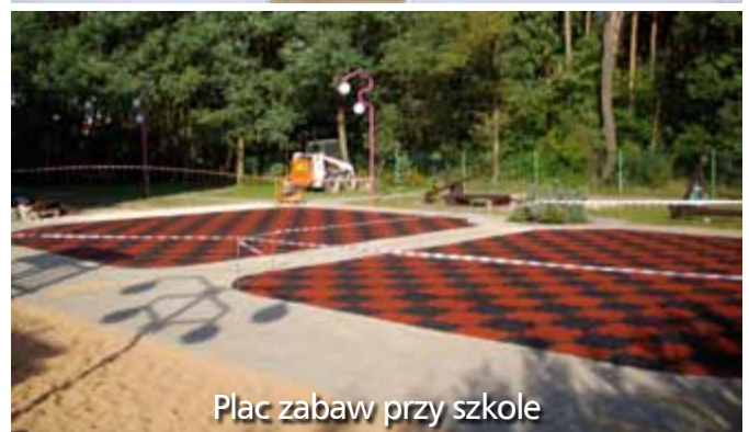
Plac zabaw przy szkole