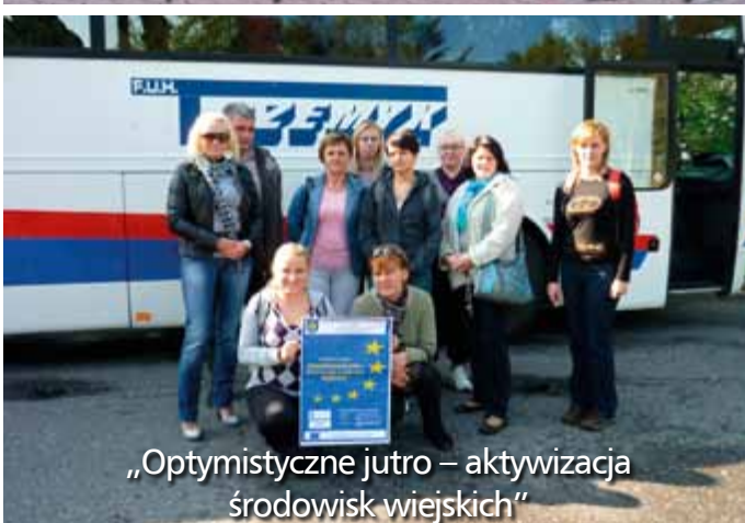
„Optymistyczne jutro – aktywizacja środowisk wiejskich”