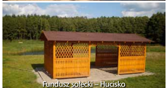
Fundusz sołecki – Hucisko