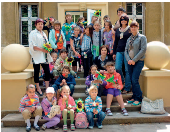
Bibułkowe kwiaty – warsztaty w Poraju