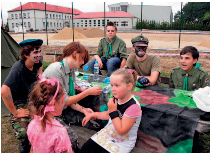
Festyn hiszpańskie klimaty