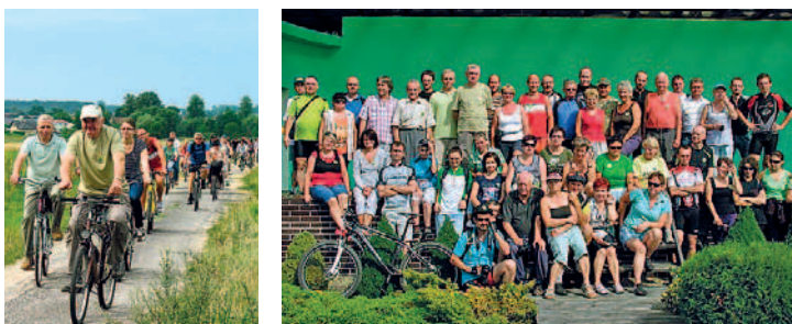
Rajd rowerowy „5 dni w Bractwie Kuźnic”