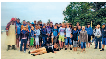
Wakacyjna przygoda w Mikoszewie