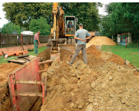
budowa kanalizacji w Hucisku