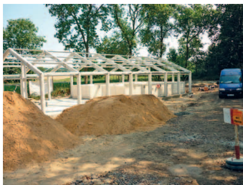
budowa oczyszczalni w Hucisku