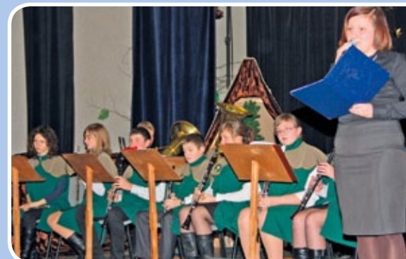
Karnawałowe spotkanie przy kawie Stowarzyszenia Miłośników Ziemi Boronowskiej