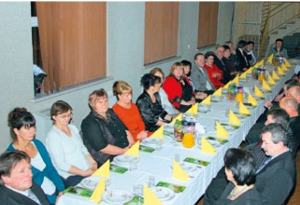
Karnawałowe spotkanie przy kawie Miłośników Ziemi Boronowskiej