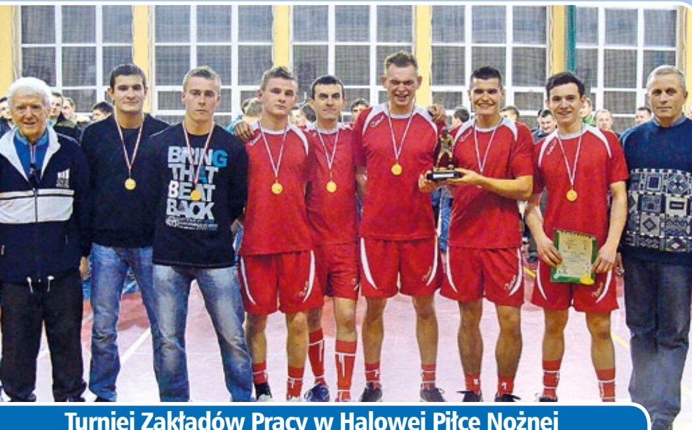
Turniej Zakładów Pracy w Halowej Piłce Nożnej o Puchar Wójta Gminy Boronów