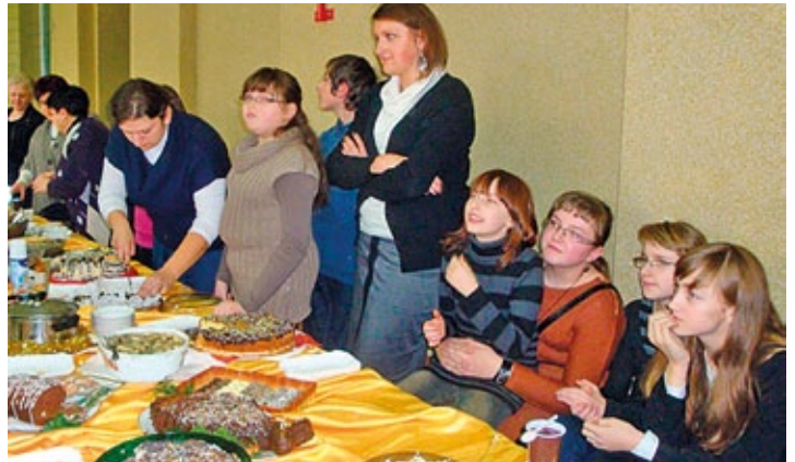
Świąteczny Kiermasz Stowarzyszenia dla Boronowa