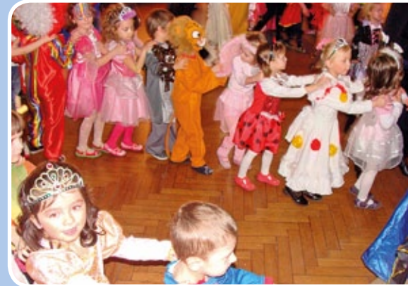
Bal karnawałowy przedszkolaków i dzieci z młodszych klas