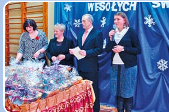
Świąteczny Kiermasz zorganizowany przez Stowarzyszenie dla Boronowa

Ferie na sportowo • Koncert Noworoczny • Zwrot Podatku Akcyzowego – Ważne Informacje!