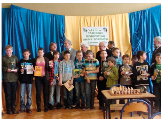
XV Szachowe Mistrzostwa Gminy Boronów im. Zenona Janika