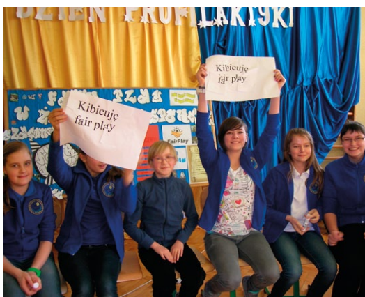
Szkolny Dzień Profilaktyki