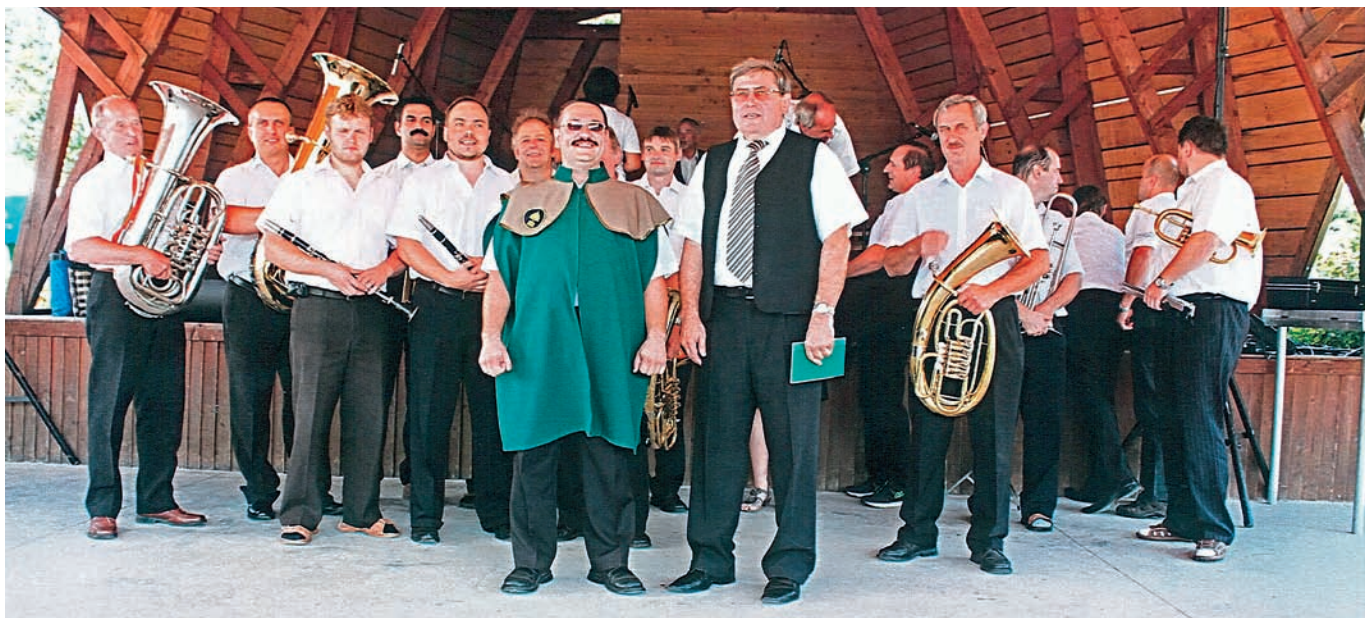
Wyjazd orkiestry na Ligotsky Jarmark