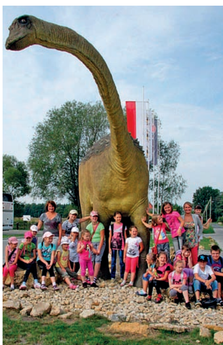
Nasze wakacyjne wojaże

Wydawca: Urząd Gminy w Boronowie ul. Dolna 2 tel. 34 3539 100 34 3539 110 34 3669 811 e-mail: gmina@boronow.pl