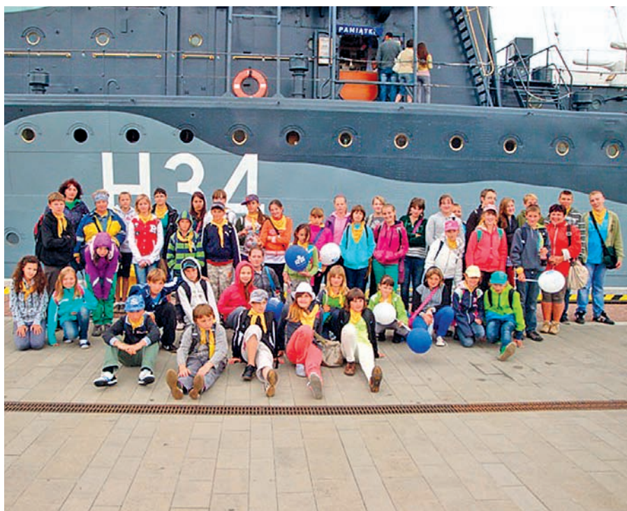
Aktywne kolonie we Władysławowie