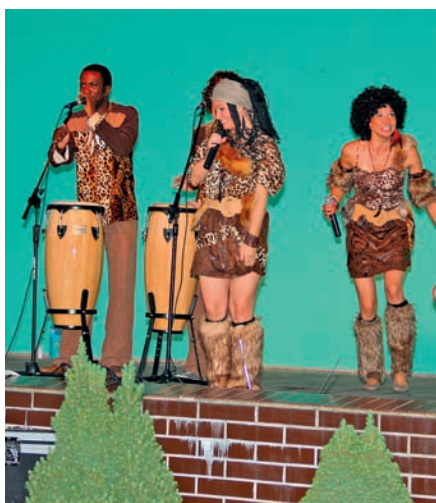
Zespół Coco Afro