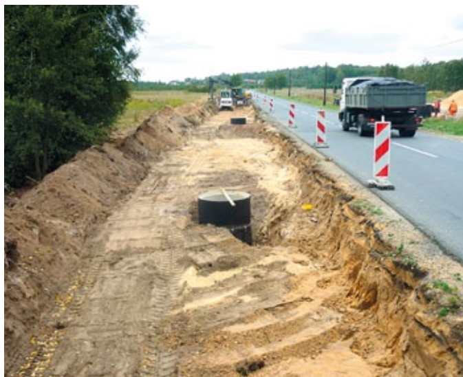
Budowa ścieżki w kierunku Zumpów –II etap