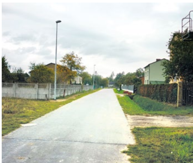
Rozbudowa oświetlenia w Zumpach