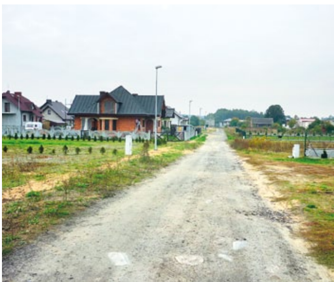
Rozbudowa oświetlenia – ul. Pogodna