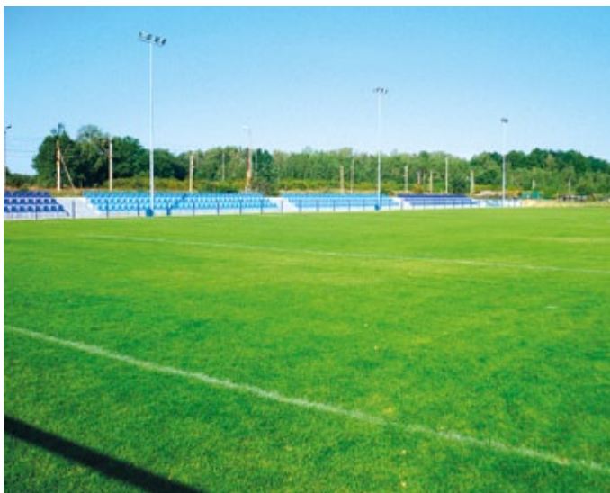
Boisko LKS Jedność