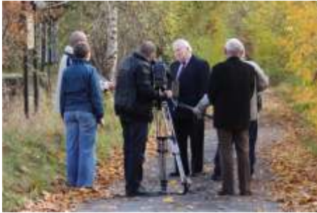
TVP Katowice - w Dębowej Górze