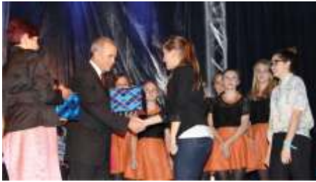
Laureatki Nagrody Wójta Gminy Boronów