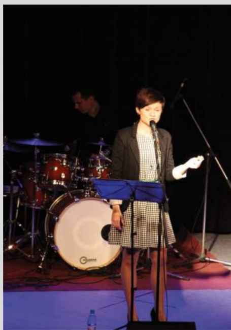
Koncert Mikołajkowy w wykonaniu studentów AM im. J. Długosza w Częstochowie

Dziękuję Wójtowi Gminy Boronów za objęcie patronatem tej imprezy i ufundowanie nagród. Dziękuję wszystkim widzom za spontaniczny udział w Koncercie Galowym Laureatów. Gratuluję wszystkim laureatom sukcesu i życzę kolejnych.