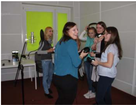
ZESPÓŁ AGAT - w studio przed nagraniem