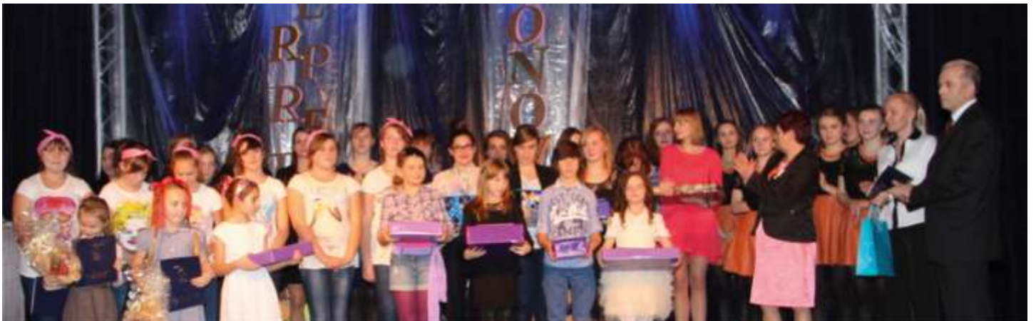
Laureaci Interpretacji 2013