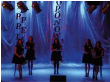
ZESPÓŁ AGAT laureat I miejsca