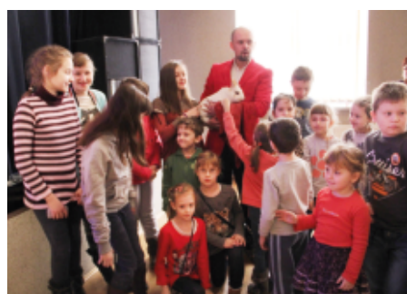
Spotkanie z magikiem