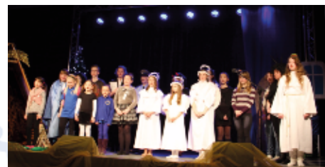
Czekamy na jasełka - Studio teatralne pod reflektorami