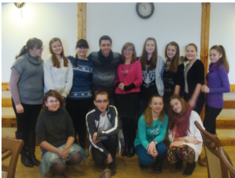
Uczestnicy projektu "Na własne konto"