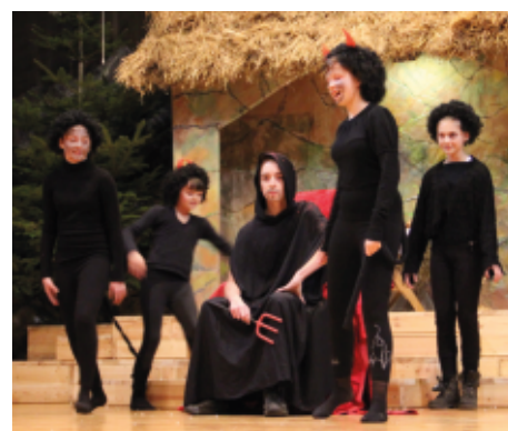
Studio teatralne pod reflektorami - konkurs we Wręczycy Wielkiej