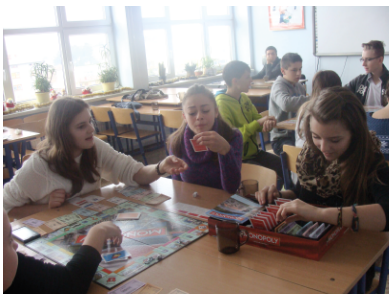
"Na własne konto"

W ramach programu zmiany wizerunku polskiej wsi nasza gmina przystąpiła do realizacji edukacyjnego programu dla młodzieży gimnazjalnej „Na własne konto”. Program został przygotowany przez Europejski Fundusz Rozwoju Wsi Polskiej we współpracy z organizacją „Polska wieś 2000” i Narodowym Bankiem Polskim. Do programu przystąpiło siedemnastu uczniów naszego gimnazjum. Podczas pierwszego tygodnia ferii zimowych młodzież wzięła udział w zajęciach z ekonomii. Po zakończeniu ferii, w czasie drugiego semestru, uczniowie wykonują pracę projektową. Będzie to gazeta ekonomiczna dotycząca naszej gminy.