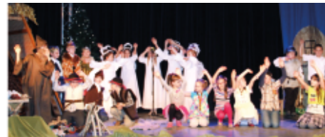
Jasełka w wykonaniu uczniów klasy III