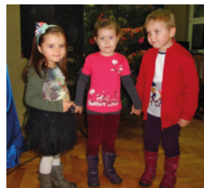
Najmłodsze uczestniczki Wspólnego Kolędowania