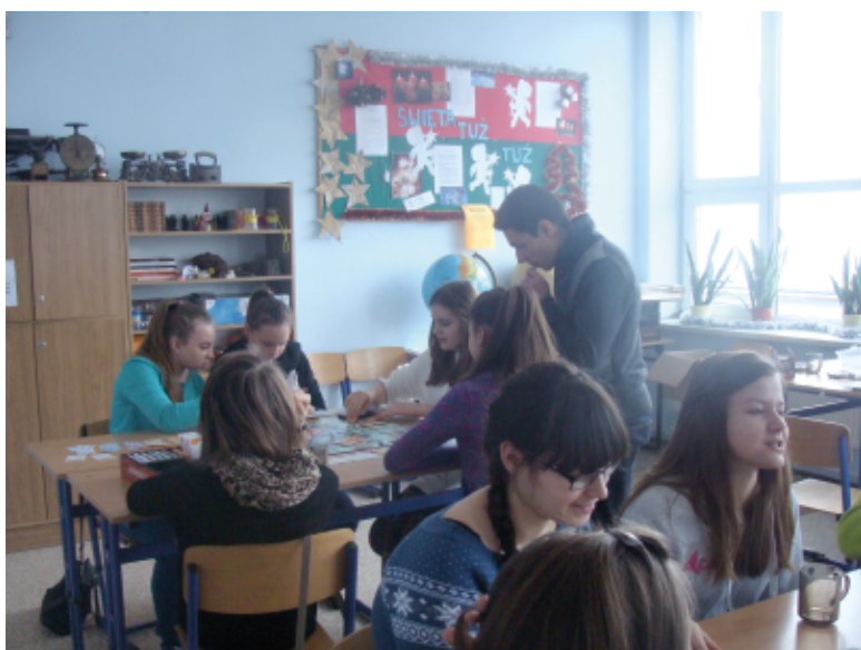
"Na własne konto"