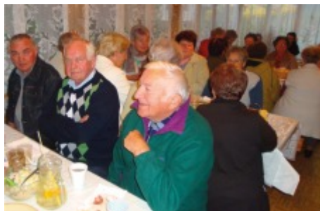
Spotkanie integracyjne w Zumpach