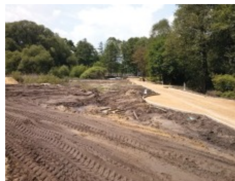
Zagospodarowanie terenu przy skrzyżowaniu ulic Wolności i Wojska Polskiego od strony południowo-wschodniej - etap II