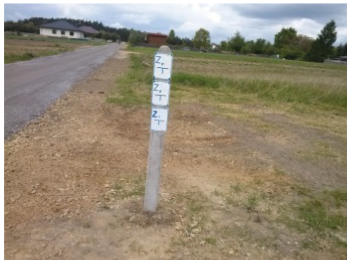
Rozbudowa sieci wodociągowej na ul. Tartacznej i Słonecznej w Zumpach