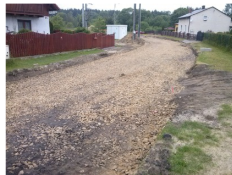
Przebudowa nawierzchni wraz z odwodnieniem ulicy Powstańców Śl. oraz ulic przyległych