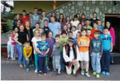
Pamiątkowe zdjęcie z gawędziarzem