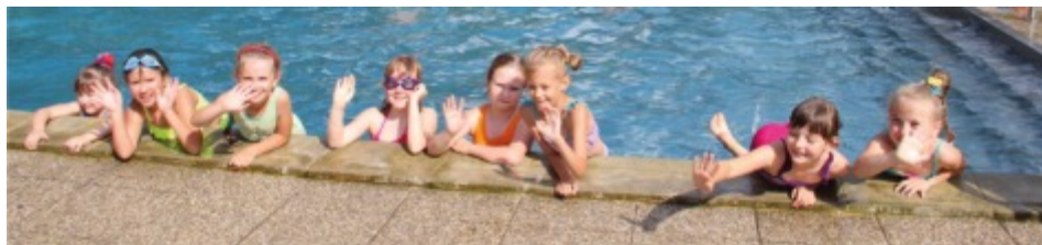
Na basenie w Czechach