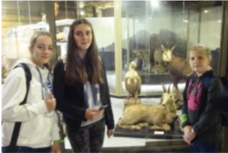
W siedzibie Tatrzańskiego Parku Narodowego