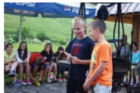
Konkurs kolonijnej piosenki