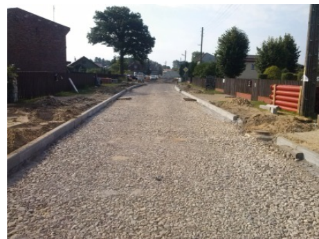
Przebudowa nawierzchni wraz z odwodnieniem ulicy Powstańców Śl. oraz ulic przyległych