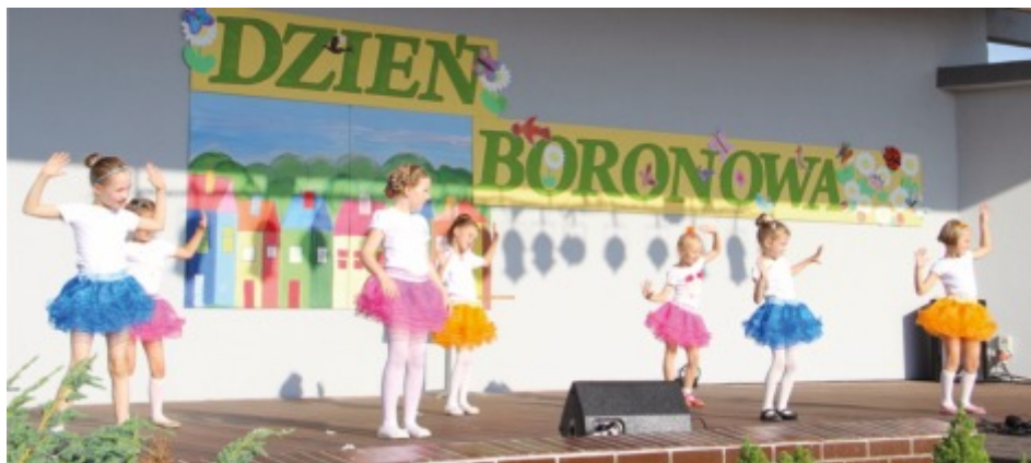
Zespół taneczny na scenie

Żywioł i ogień na scenie, doskonały repertuar i kontakt z publicznością i to całkowicie na żywo – to opinia o zespole „REDLIN”. Artyści tego renomowanego zespołu przedstawili koncert „Cztery strony”. Znane utwory, wśród których znalazł się między innymi węgierski czardasz, rosyjska „Kalinka” czy amerykański „Yankee Doodle” oraz nasze góralskie rytmy „Idzie dysk” i nie tylko, w folkowym wykonaniu sprawiły, że zgromadzeni widzowie mogli poczuć