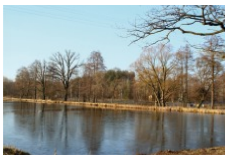
Stawy na Dolach wczesną wiosną