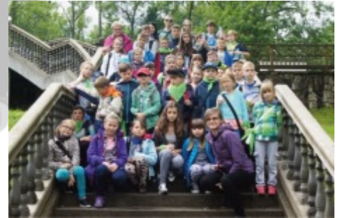
Wycieczka do Zakopanego