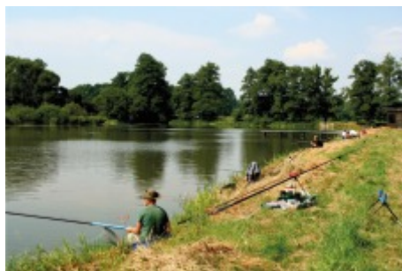
Półw karpia w stawach na Dolach