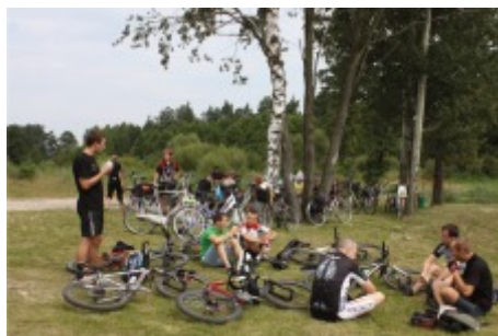
Rajd rowerowy "Dookoła Boronowa"