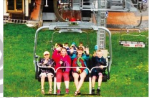
Przejażdżka wyciągiem krzeselkowym