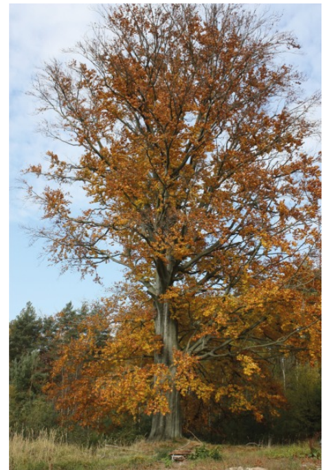
Buk na Szklanej Hucie

We wszystkich rejonach naszej gminy napotkać można piękne i pełne nastroju zakątki krajobrazowe i okazałe pomniki przyrody, których na tym terenie jest aż 26. Mamy koło Szklanej Huty ciekawy rezerwat leśny o powierzchni 8 ha z zachowanym fragmentem dawnych przepastnych lasów o naturalnym charakterze z pięknymi okazami dębów i buków oraz rzadkich gatunków roślin. Zachwyć mogą piękne stawy śródleśne na Dołach oraz w pobliżu drogi z Zumpów do Hadry. W rozlewisku Leńcy, na Przykutowym można zaobserwować działalność rzadko występujących i będących pod ochroną bobrów (niestety, ich rodzina rozrosła się już do tego rozmiaru, że zaczynają one powoli