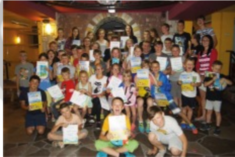
Wieczór podsumowujący kolonie