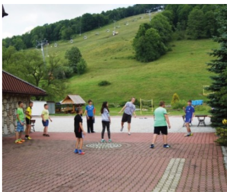
Gry sportowe przed ośrodkiem kolonijnym