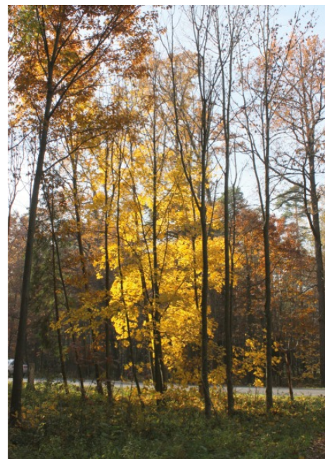
Przy drodze do Koszęcina