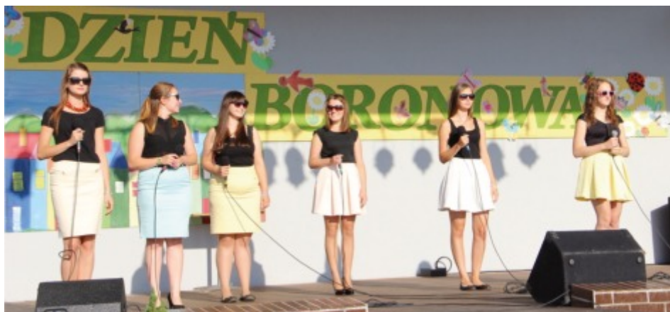
Dzień Boronowa - AGAT

Kolejnym punktem programu były występy artystyczne dzieci i młodzieży, którzy aktywnie spędzają wakacje w GOK-u. Swoje umiejętności zaprezentowały dwa zespoły taneczne – „Promyczki” i „Krzyk”, które swoim tańcem i dziecięcą żywiołowością zachwyciły zgromadzonych. Zgodnie z tradycją zespół „AGAT” w nowym