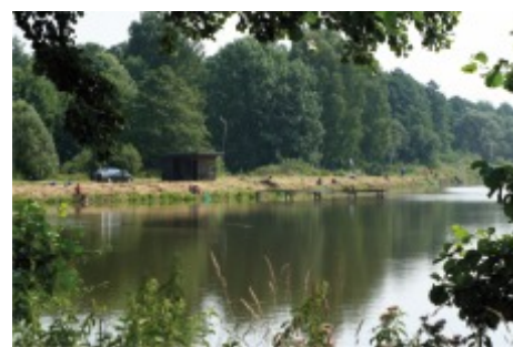
Stawy rybne na Dolach