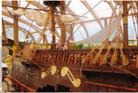
Pobył w Tatralandii na Słowacji