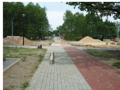
Zagospodarowanie terenu przy skrzyżowaniu ulic Wolności i Wojska Polskiego od strony południowo-wschodniej