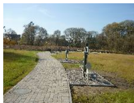
Siłownia zewnętrzna w parku