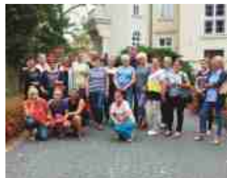
Przed Zamkiem w Pawłowicach. Wizyta studyjna.

a także miałyśmy okazję wykonać zapachowe woreczki z materiału i suszu kwiatowo - ziołowego. Degustowałyśmy domowe wypieki oraz orzeźwiający napój na bazie syropu z kwiatów czarnego bzu. W wiosce drewna przeszliśmy „ścieżką zdrowia”, czyli boso po różnego rodzaju szyszkach. Zrobiłyśmy korale z drewna. Natomiast w „miodowej krainie” miałyśmy okazję skosztować wyśmienitych, miodowych smakołyków, zrobić świeczki z wosku. Wizyta studyjna dostarczyła nam wiedzy na temat ekologicznego stylu życia.