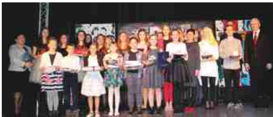
Laureaci INTERPRETACJI - 2016