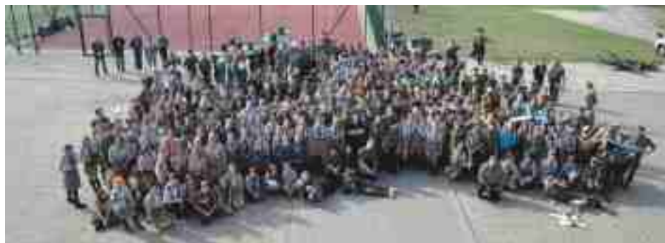
Uczestnicy rajdu Szare Szeregi