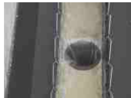
Ściek oczyszczony wypływający z oczyszczalni