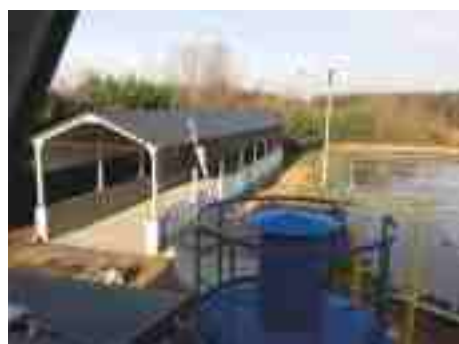
Wiata na osad