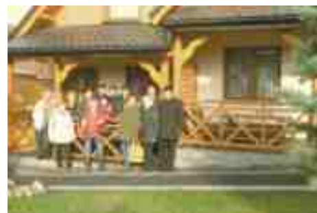
Niedzica - Kacwin.