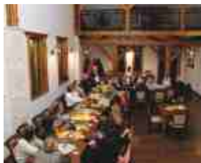
Spotkanie SMZB w Nad Liswartą

Stowarzyszenie Miłośników Ziemi Boronowskiej zorganizowało w dniu 10.11.2016. spotkanie swoich członków z osobami towarzyszącymi w restauracji „Nad Liswartą”. Cykliczne spotkania SMZB integrują wszystkich zebranych, są dobrą formą odpoczynku, rozrywki i relaksu po całodzienniej pracy.