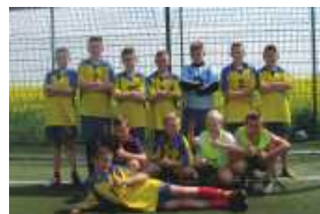
I miejsce SP