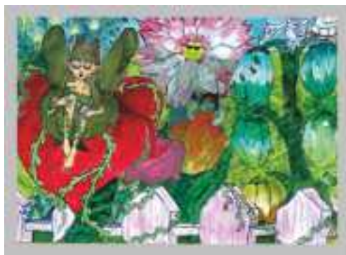
praca ANDŻELIKI SMOL - lat 13 GOK Boronów - II miejsce