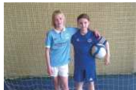
Piłkarki Gol Cz--wa