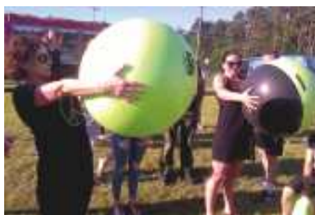
Konkurs trzymanie piłki na czas