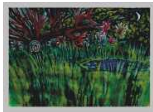
praca MARCELA MAŁYSY - lat 13 GOK Boronów - III miejsce

Stowarzyszenie Miłośników Ziemi Boronowskiej ul. Poznańska 1 - 41-283 Boronów www.stowarzyszenie-smzboronow.pl