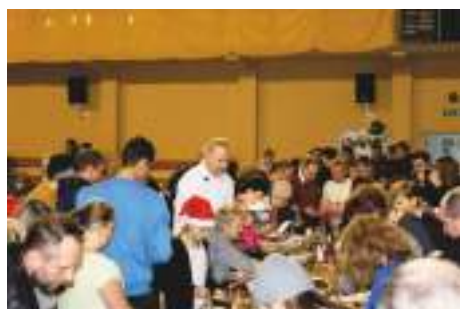
Degustacja i wybór najsmaczniejszych dań konkursu