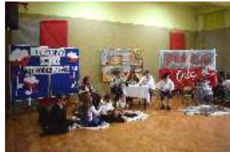
Obchody 11 listopada