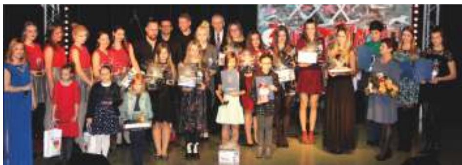
Laureaci XXX konkursu Interpretacje