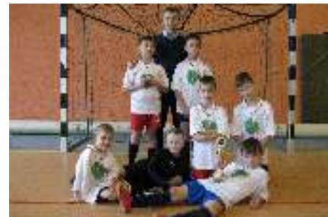
II miejsce w powiecie Tymbark Cup 2017 U-10