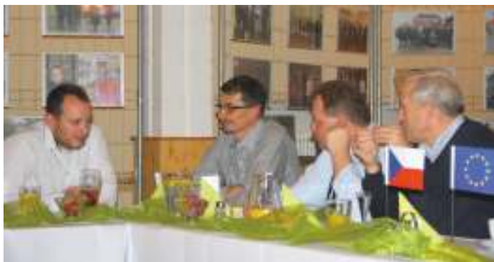
Spotkanie październik 2017