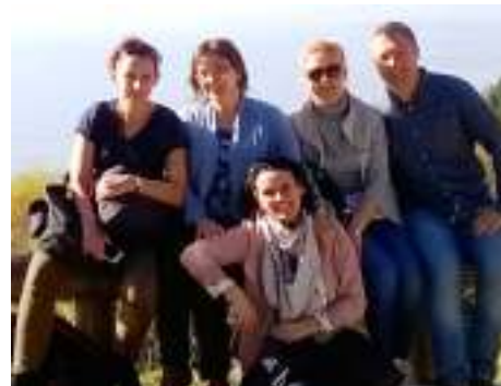
Grupa nauczycieli biorąca udział w Programie ERASMUS + podczas edukacyjnej wycieczki do Bregenz.