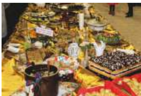
Stół ze smakołykami świątecznymi