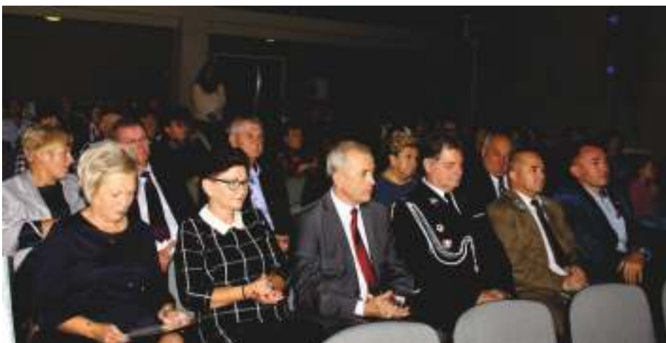
Zaproszeni goście na jubileusz 10-lecia SMZB