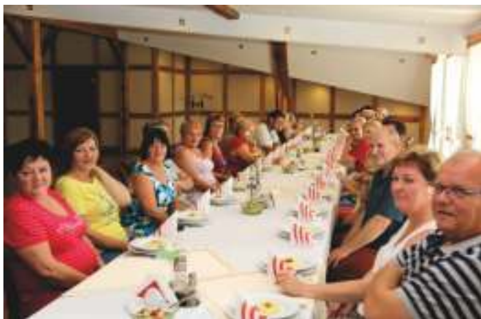
Powitanie i obiad gości z PZKO Komorni Lhotki Czechy

Dziękujemy za udostępnienie zdjęć P. Alojzemu Mojowi.