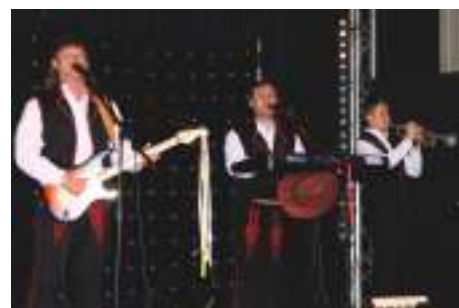
Zespół muzyczny Bella Musica