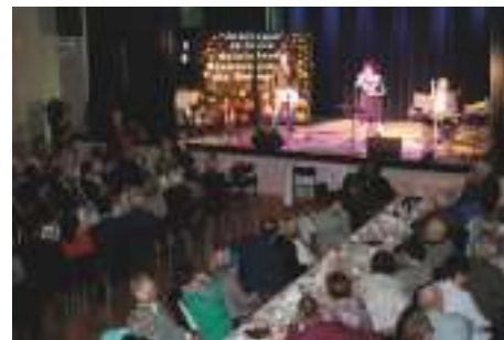
W czasie koncertu