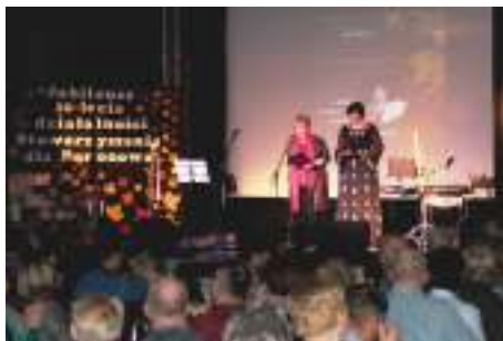
Powitanie przybyłych na jubileusz