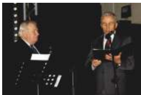
Przekazanie życzeń przez wójta