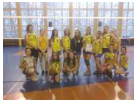
II m siatkarki