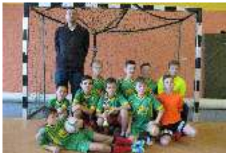
Drużyna U-12 Mistrz powiatu Tymbark Cup 2017

Po wygraniu finału powiatowego nasza drużyna U-12 awansowała do zawodów wojewódzkich, które zostaną rozegrane wiosną, a potem - może finał krajowy na Stadionie Narodowym w Warszawie. Brawo młodzi futboliści.