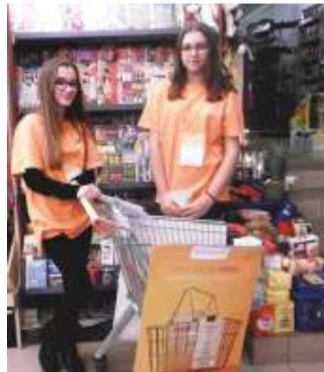
Wolontariusze Świątecznej Zbiórki Żywności