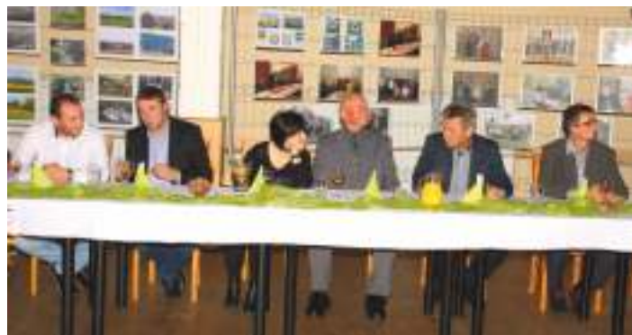
Spotkanie w Czechach 2017