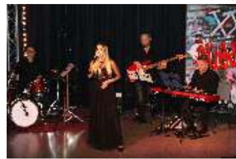
Laureatka nagrody wójta