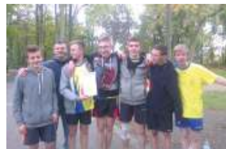
III m w regionie sztafetowe biegi przełajowe