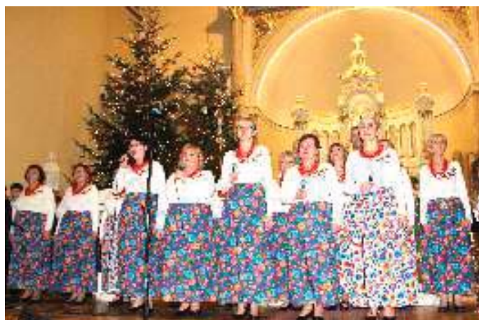
Laureaci III miejsca - Boronowianie