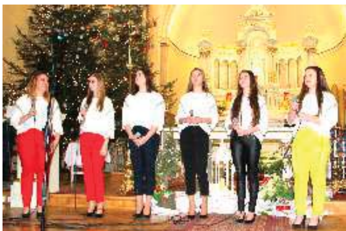
Laureatki I miejsca - AGAT