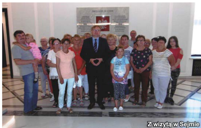
Z wizytą w Sejmie