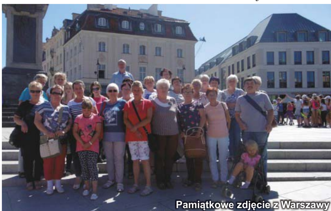
Pamiątkowe zdjęcie z Warszawy