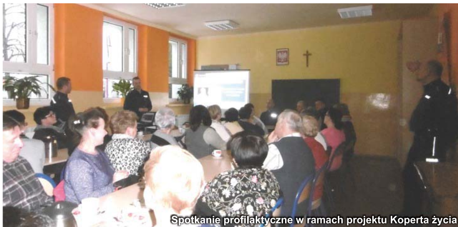
Spotkanie profilaktyczne w ramach projektu Koperta życia