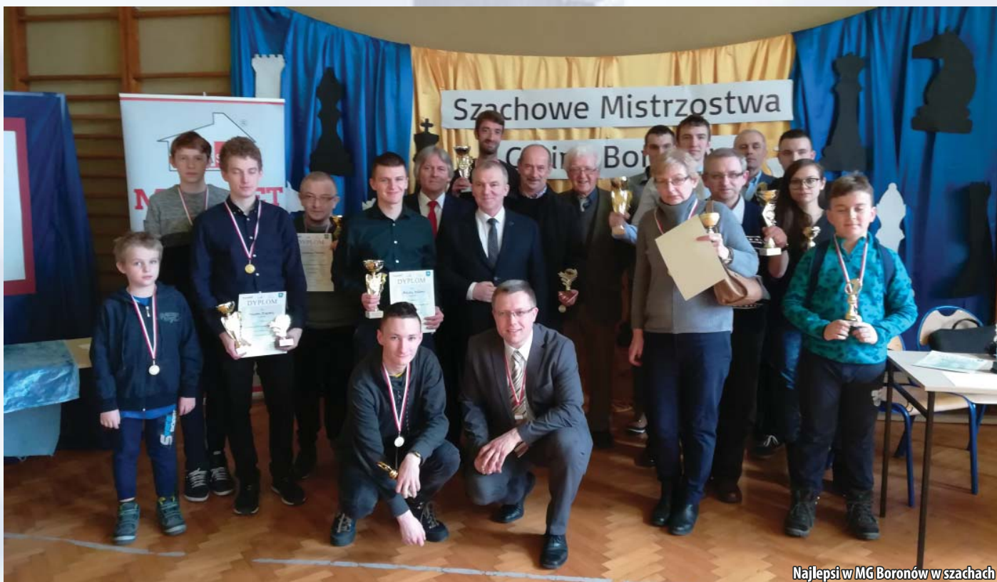
Najlepsi w MG Boronów w szachach