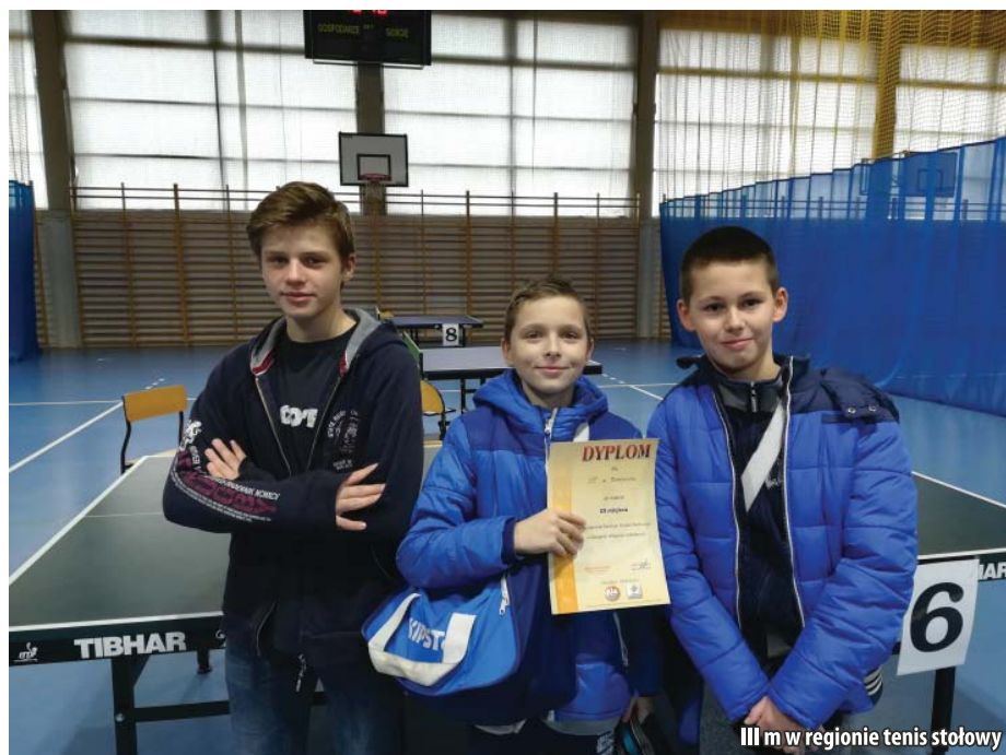
III m w regionie tenis stołowy

To kolejne podium naszych młodych tenisistów. Brawo.