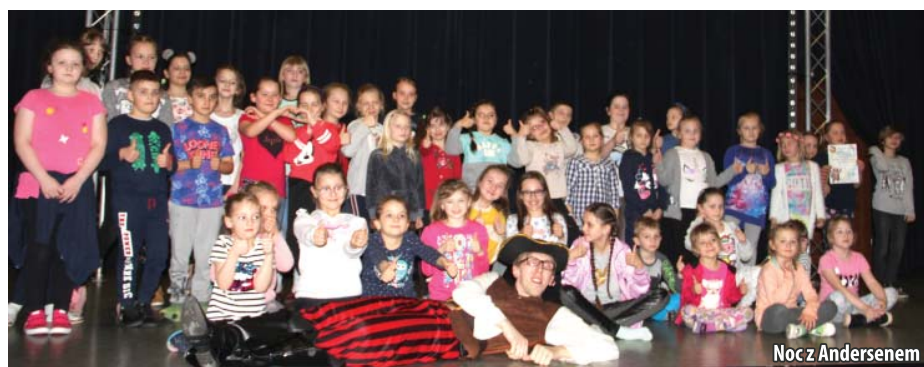
Noc z Andersenem

Po kolacji nie mogło zabraknąć tradycyjnego już buszowania z latarkami w bibliotece. Aby jednak nie był to zwykły spacer między regałami z książkami, każde dziecko miało za zadanie z magicznej czarnej skrzyni wylosować tytuł książki,