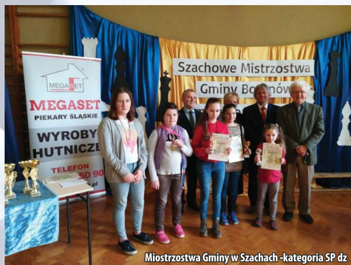
Mistrzostwa Gminy w Szachach -kategoria SP dz