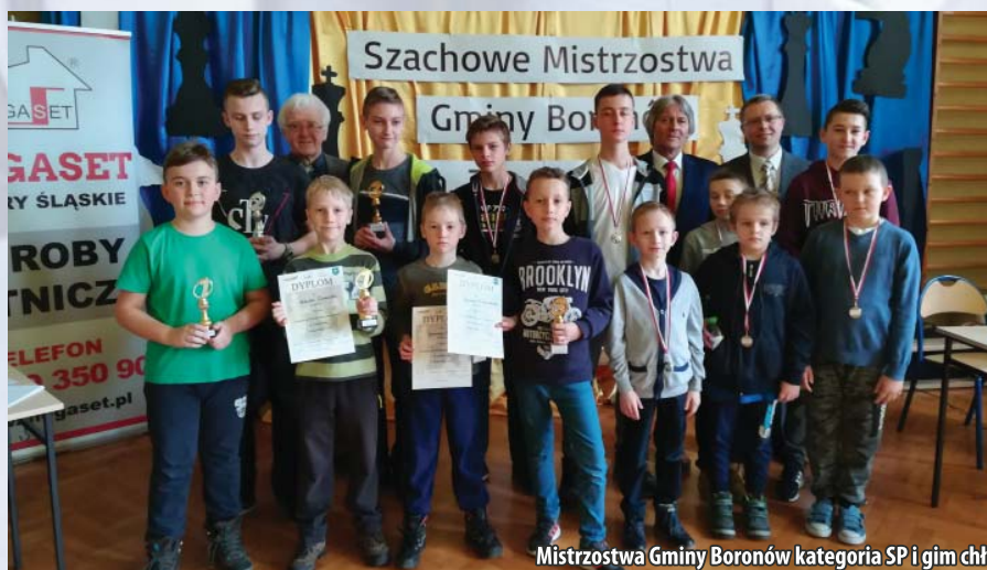
Mistrzostwa Gminy Boronów kategoria SP i gim chl