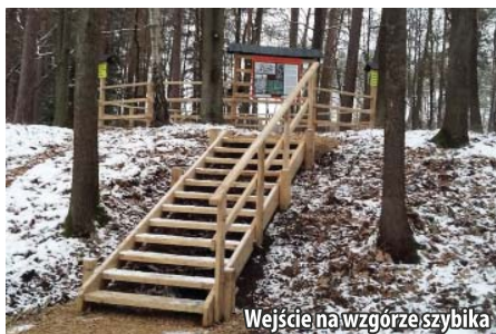
Wejście na wzgórze szybika