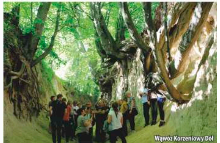
Wąwóz Korzeniowy Dół