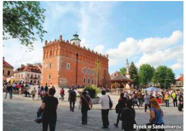
Rynek w Sandomierzu