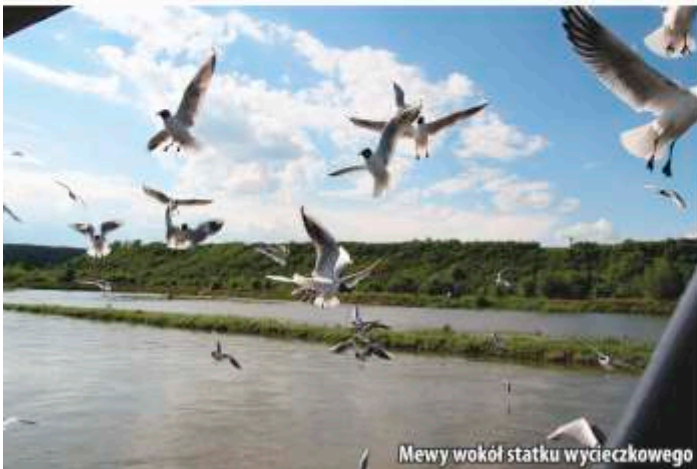
Mewy wokół statku wycieczkowego