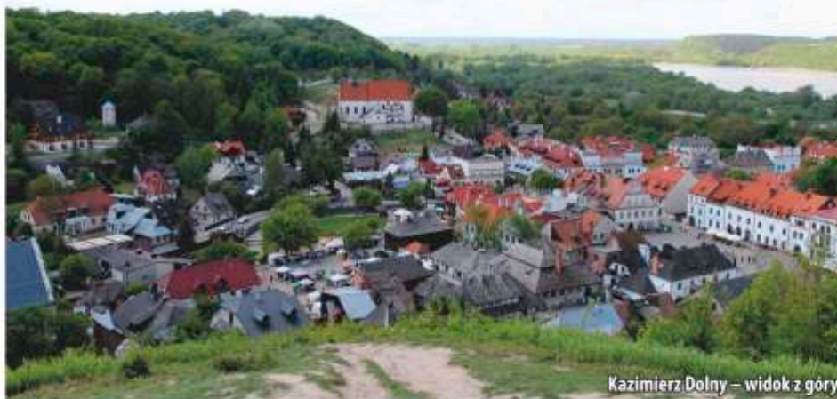
Kazimierz Dolny – widok z góry