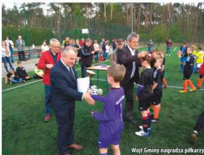
Wójt Gminy nagradza piłkarzy