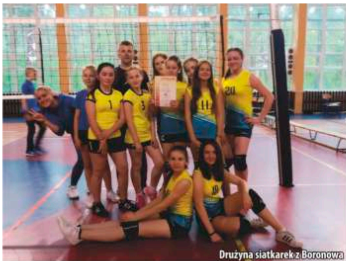
Drużyna siatkarek z Boronowa