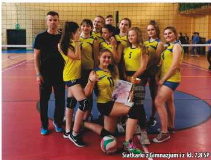
Siatkarki z Gimnazjum i z kl. 7,8,SP