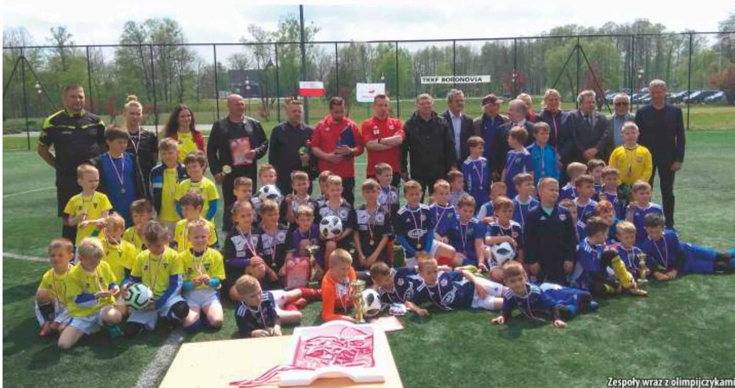
Zespoły wraz z olimpijczykami