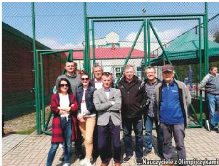
Nauczyciele z Olimpijczykami