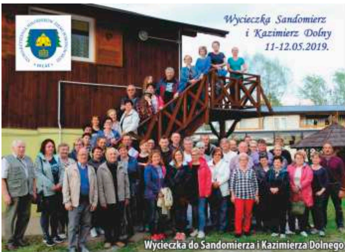
Wycieczka do Sandomierza i Kazimierza Dolnego