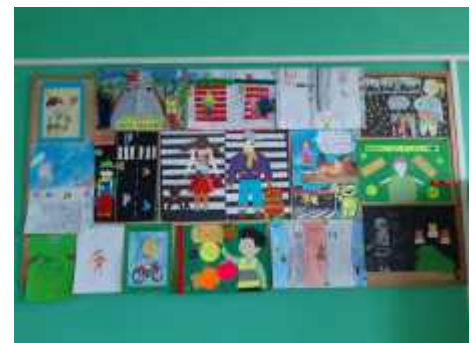
Galeria prac konkursowych