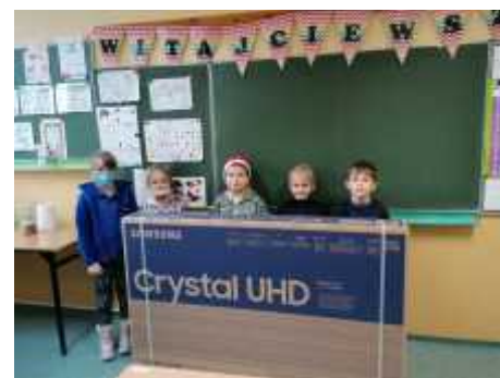
Nowo zakupione telewizory