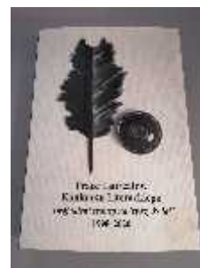
Publikacja zawierająca nagrodzone prace