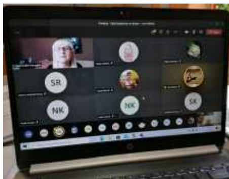
Prelekcja online prowadzona przez opiekuna szkolnego Klubu Bezpieczeństwa "Zielony Listek" - panią Agatę Kudlek-Domagałę