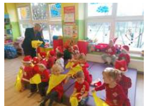
Przekazanie chust odblaskowych przez Wójta