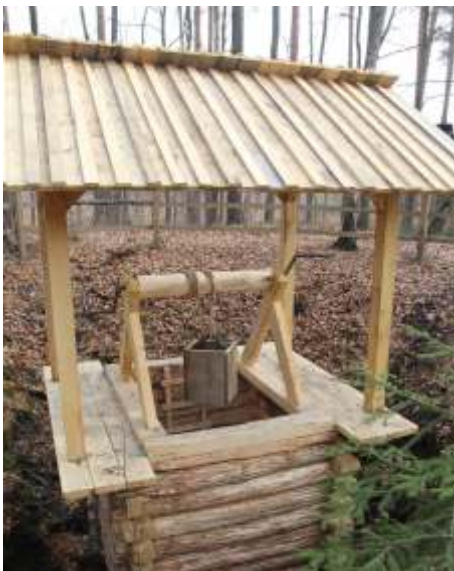
Kołowrót do transportu rudy