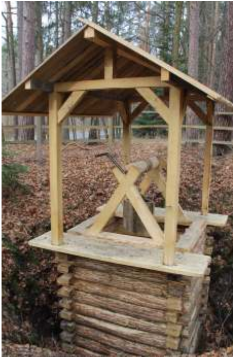
Wylot szybika i podnoszenia urobku