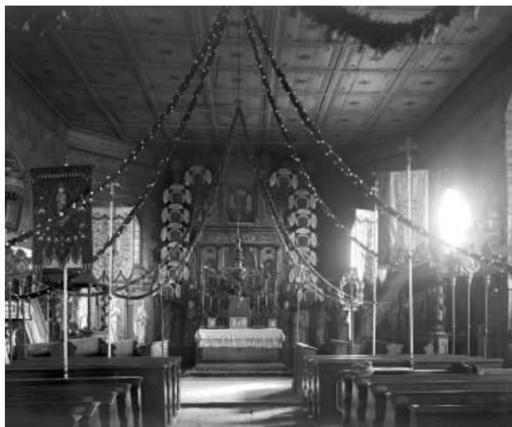
Wnętrze kościoła w Boronowie, ok. 1920 roku