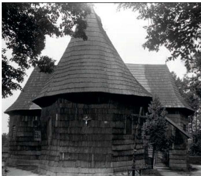
Kościół w Boronowie, ok. 1920 roku