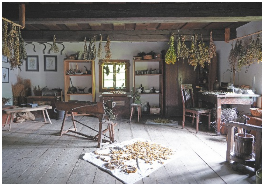
Wnętrze chatki zielarki