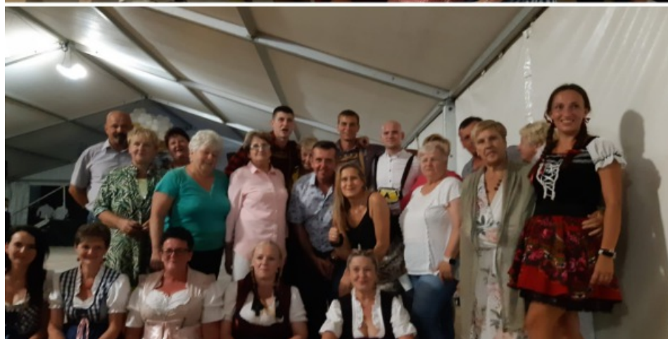
Impreza biesiadna Ranczofest