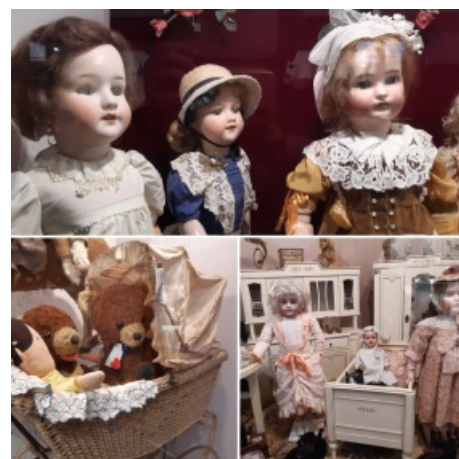
W muzeum zabawek