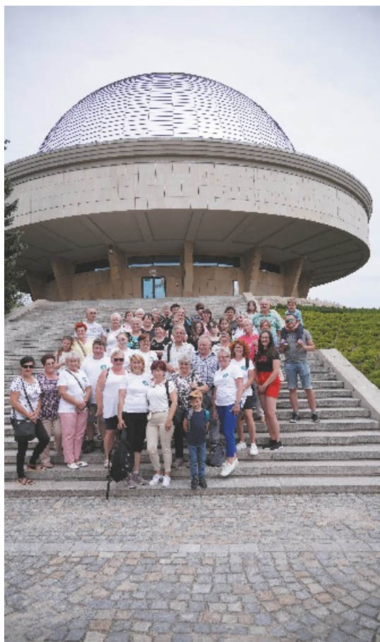
Wyjazd do Chorzowa