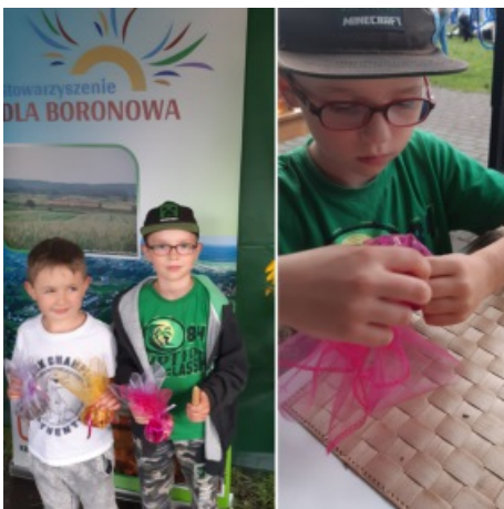
Warsztaty dla dzieci