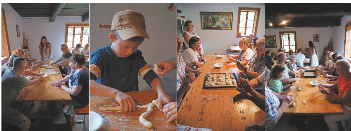
Warsztaty pieczenia chleba