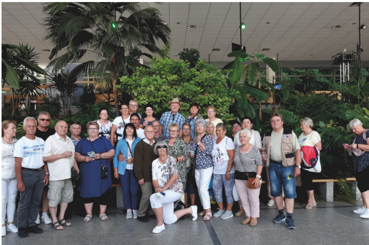
Pijalnia wód mineralnych Krynica Zdrój