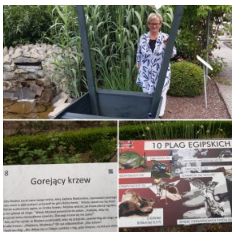
W ogrodzie biblijnym