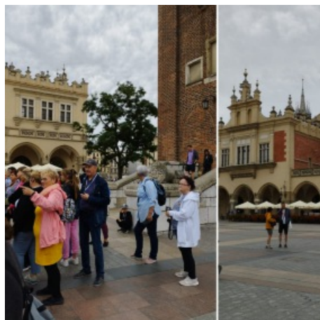
Na Starym Mieście w Krakowie