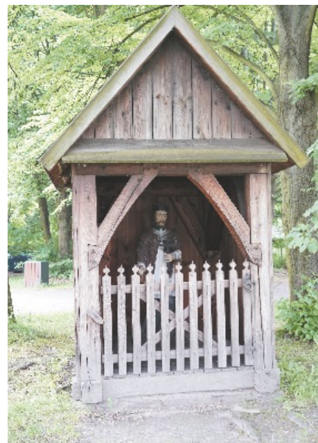
Kopia kapliczki z Dębowej Góry znajdująca się w Chorzowie