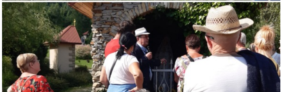
Golgota z drózkami różańcowymi