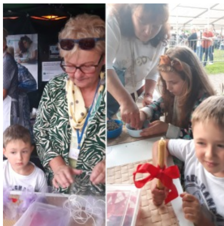
Warsztaty dla dzieci Cerkiew w Powroźniku