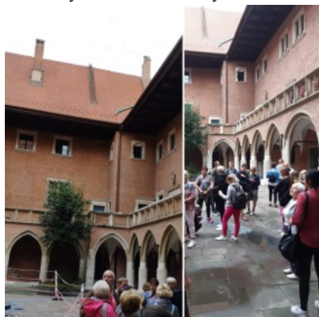
Na dziedzińcu uniwersyteckim