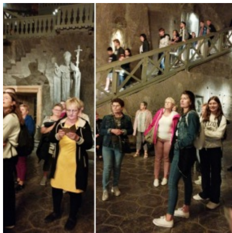
Wnętrza zabytkowej kopni prezentują się wspaniale