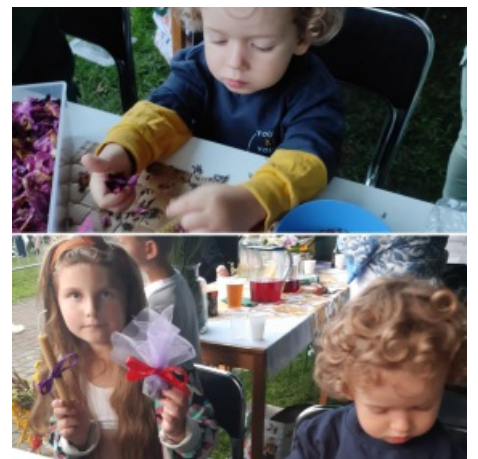
Warsztaty dla dzieci