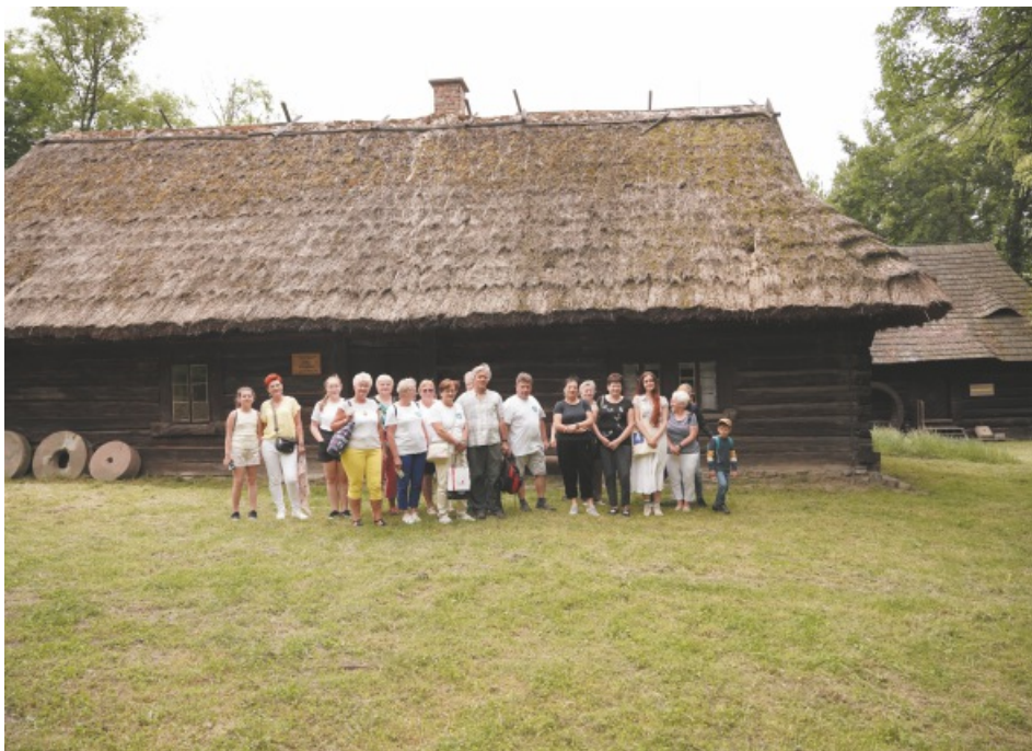
Skansen w Chorzowie

Następnym punktem naszego programu było Śląskie Planetarium. Planetarium Śląskie powstało w 1955 roku jako pierwsza tego rodzaju placówka w Polsce. W 2018 roku rozpoczął się proces przebudowy i modernizacji, który zakończono cztery lata później. Jest obecnie jednym z najnowocześniejszych parków nauki na świecie. Dlatego z wielką