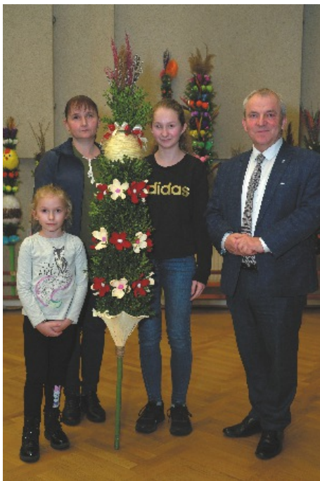
Najładniejsza palma wraz z twórczyniami