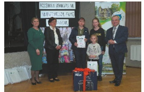
Rodzina ZOK I miejsce w konkursie