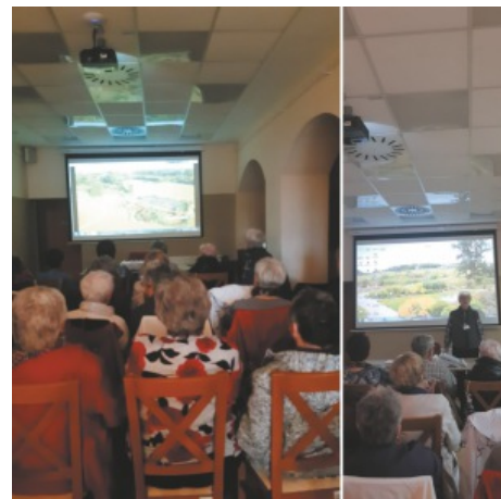
Spotkanie z Seniorami w Mikołowie