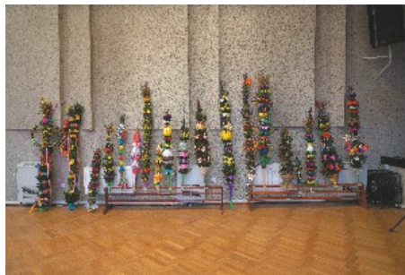
Palmy zgłoszone do konkursu