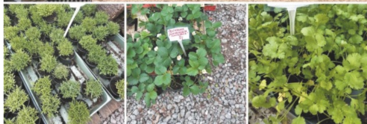
W gospodarstwie Niezle ziółka