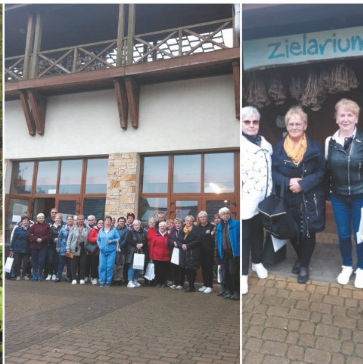
Spotkanie z seniorami w Mikołowie