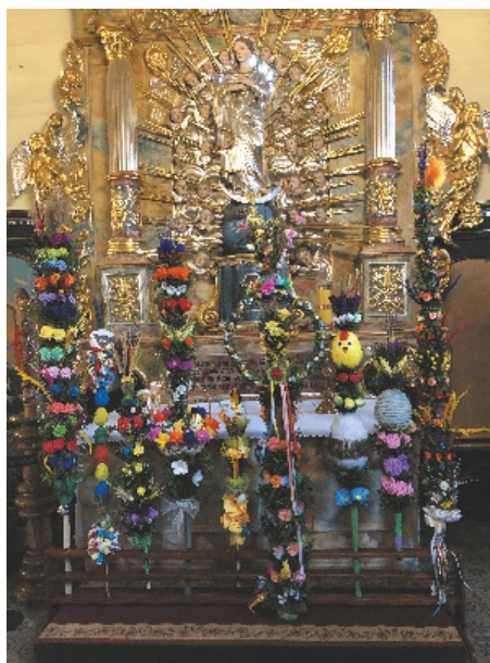
Wystawa w parafialnym kościele w Boronowie