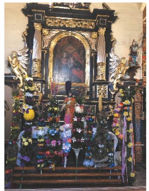
Wystawa w parafialnym kościele w Boronowie